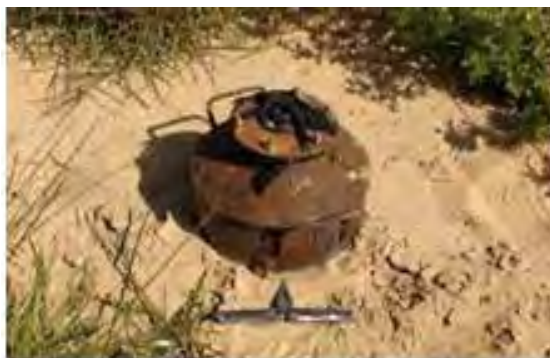
El artefacto, descubierto en el centro de la Franja de Gaza y neutralizado (Portavoz de FDI, 26 de marzo de 2012)

■ Fuerzas de Tzahal (Fuerzas de Defensa de Israel) que se encontraban en una actividad operacional cerca de la valla de seguridad en el centro de la Franja de Gaza, descubrieron un artefacto explosivo que había sido colocado muy próximo a la valla. El artefacto, cuyo objetivo era dañar a los soldados de Tzahal, había sido colocado según parece la semana pasada al abrigo de la niebla que reinaba en la región.