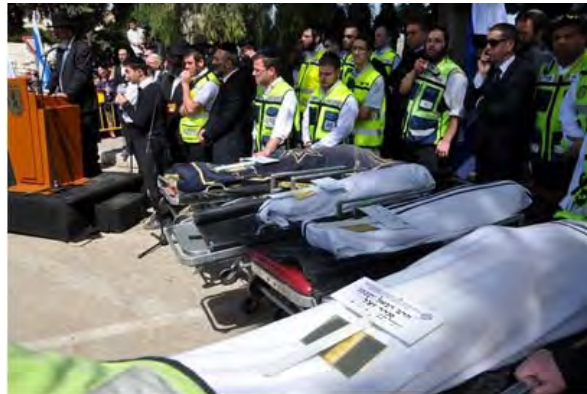
Entierro en Jerusalén, de las cuatro víctimas asesinadas en el atentado de Toulouse. (22 de marzo de 2012)