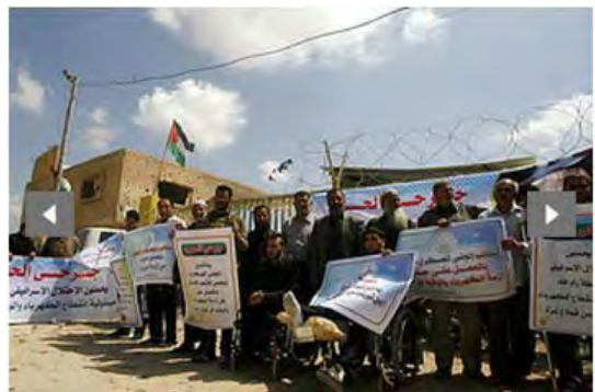
Manifestaciones en la Franja de Gaza, sobre el trasfondo de la crisis energética. (26 de marzo de 2012)