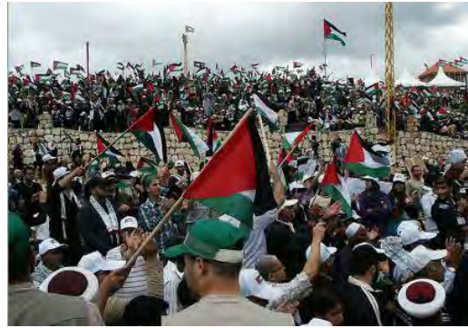
La ceremonia en Maroun al-Ras, antes de la marcha de manifestantes hacia la cerca de la frontera durante el "Día de la Nakba", "el 15 de mayo de 2011