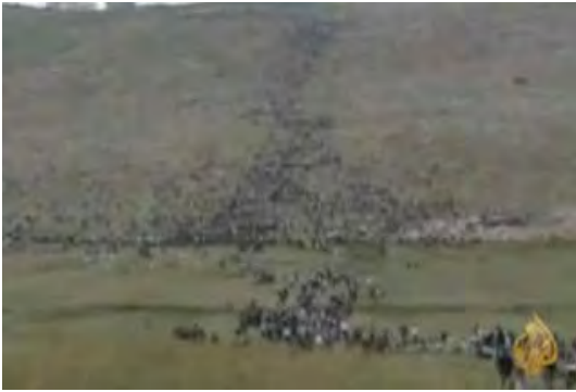
Un gran grupo de manifestantes se dirige en Maroun al-Ras hacia la frontera con Israel en los sucesos del "Día de la Nakba"

sitio en vehículos especialmente contratados. Hacia el fin del acto, los participantes empezaron a marchar hacia la frontera con Israel portando pancartas con la consigna del retorno a Palestina. Durante los enfrentamientos violentos y transmitidos por la prensa que tuvieron lugar entre un grupo de manifestantes que llegó a la cerca de la frontera y soldados de Tzáhal murieron unos diez manifestantes y decenas resultaron heridos (algunos de ellos por balas del Ejército libanés, que intentó contener el evento e impedir el asalto al territorio israelí). 3