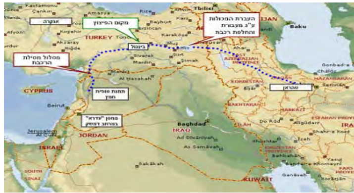
Trayecto del tren y sitio de la explosión que reveló el contrabando de armamentos