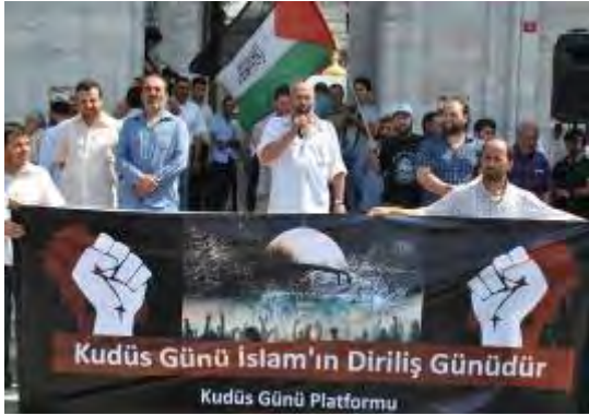
"Día Al-Kods, día de la resistencia islámica (Foro Al-Kods) (velfaccr.com)