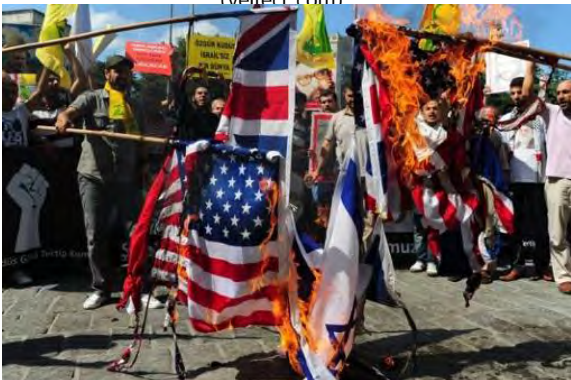
Quema de banderas de Israel, EUA y Gran Bretaña. Al fondo banderas de Jezbolá