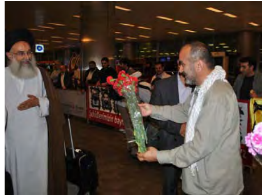
Shirin (derecha) recibe al ayatolá Kaimakami (1 de junio de 2011)