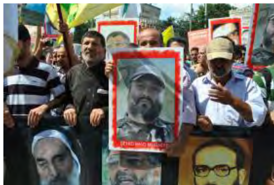
Manifestantes con el retrato del comandante terrorista de Jezbolá Imad Mughniyeh, arriba pancarta con la leyenda "EUA, Israel y Gran Bretaña, el triángulo del diablo"