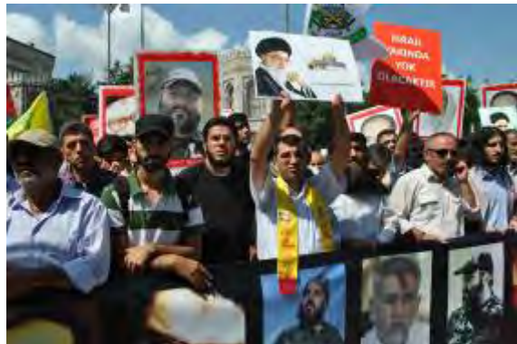
Pancarta arriba: "Judío, recuerda a Khaybar, el ejército de Mahoma volverá" 27 Pancarta abajo: "Israel desaparecerá pronto", junto a las imágenes del Líder Hamenai e Imad Mughniyeh