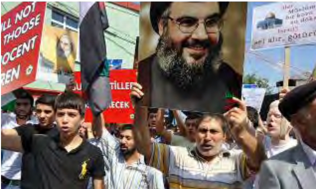
Efigie del líder de Jezbolá, jeque Hassan Nasralá en la manifestación. Detrás una pancarta en contra de Arabia Saudí: "los asesinos saudies..." (el resto ilegible)