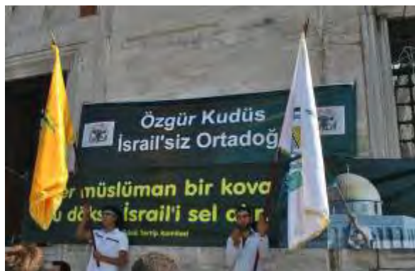
Pancarta del "Foro Día de Jerusalén" citando a Jumeiní: "Si cada musulmán arroja un balde de agua, Israel se ahogará en la inundación" 26