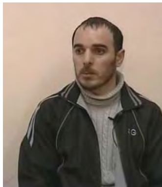
Rasim Aliyev