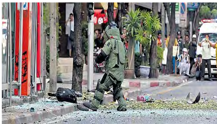
Un experto policial en explosivos neutraliza la carga junto al colegio Kasem Phithaya