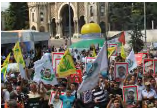
Banderas de Hamás y Jezbolá con la imagen de Imad Mughniyeh