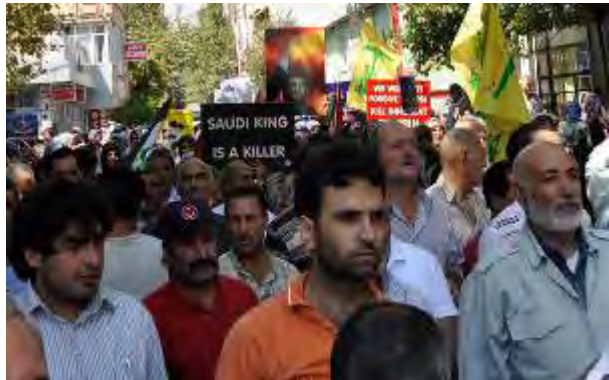
Pancarta: "El rey saudí es un asesino" (zeynebiye.com)