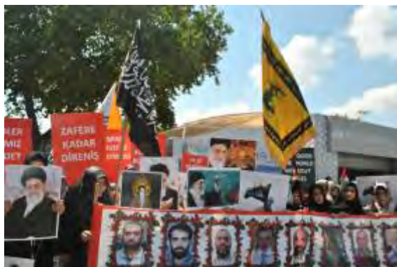
Imágenes de Jumeiní y el Líder Hamenai y debajo los muertos del "Marmara"