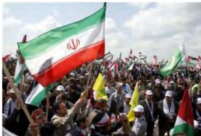
דגלי איראן וחזבאללה מונפים בעת אירועי ה-30 במרץ בלבנון (אתר GM2J, 3 באפריל 2012)