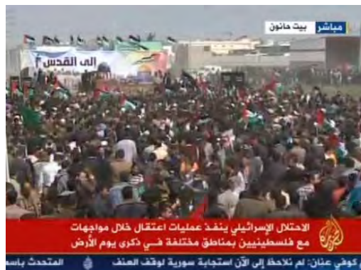
העצרת בצפון רצועת עזה (אלג'זירה, 30 במרץ 2012)

• רצועת עזה - בצפון הרצועה (בבית חאנון וסמוך למעבר ארז) הפגינו כמה אלפי פלסטינים. בהפגנה השתתפו משלחת פרלמנטארית מצרית בת 25 נציגים ופעילים מרחבי העולם (אירלנד, אינדונזיה, תורכיה). אחמד אבו חלביה , יו"ר ועדת ירושלים במועצה המחוקקת, קרא לישראל לסגת מירושלים ולהחזיר אותה לעם הפלסטיני. ממשל חמאס הודיע על תמיכתו בהפגנה אולם מנגנוני הביטחון של חמאס פעלו להכלת האירועים ובתקשורת הפלסטינית דווח על עימותים שהתנהלו בין פעילי המנגנונים לבין צעירים, שניסו להתקרב למעבר ארז (חמאס הכחישה את הדיווח). משהתקרבו הצועדים למעבר הגיבו כוחות צה"ל באמצעים לפיזור הפגנות על מנת להרחיק את המפגינים מהגדר. כתוצאה מכך נהרג פלסטיני וכ-35 נפצעו. חברו של ההרוג סיפר, כי הוא ניסה לפרוץ למעבר ארז, להוריד את דגל ישראל מהמעבר ולהחליפו בדגל פלסטין (צפא, 31 במרץ 2012).