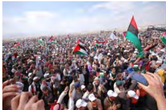
העצרת בירדן (אתר GM2J, 3 באפריל 2012)

● לבנון - בלבנון עברו האירועים בשקט , בניגוד מוחלט לאירועי "יום הנכבה" בשנה הקודמת. למרגלות מבצר הבופור התקיימה עצרת בהשתתפות כ-3,000 אנשים . מרביתם פלסטינים ממחנות הפליטים בלבנון. בין המשתתפים היו פעילי השיירה האסיאתית ופעילים מדרום אפריקה. במקום הונפו דגלי פלסטין, לבנון וחזבאללה. צבא לבנון פיקח על האירוע ונמסר, כי הוא מנע מכמה מפגינים לרדת לערוץ הליטאני לכיוון הגבול עם ישראל. בין הנואמים בעצרת היו גם נציגי חזבאללה וחמאס . נביל קאווק, יו"ר המועצה המבצעת של חזבאללה, התפאר כי ביום האדמה של שנת 2012 הרקטות של ה"התנגדות" מאיימת על תל-אביב ומרכז ישראל והדגיש, כי חזבאללה תמשיך לתמוך בפלסטין "בכל מחיר". חסן נצראללה , מנהיג חזבאללה, בנאום שנשא ב-30 במרץ לפנות ערב, הדגיש את חשיבות "יום האדמה", תקף את העולם הערבי והמוסלמי על שאין הוא ממלא אחריותו כלפי הפלסטינים, וציטט אמרה של ח'מיני, שאם היו כל המוסלמים נרתמים למערכה נגד ישראל ניתן היה להשמיד אותה.