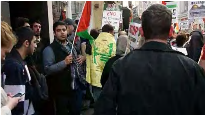
מפגין העוטה על גופו דגל חזבאללה במהלך ההפגנה בלונדון ומעליו שלט של BMI הקורא להפסקת "המצור" על רצועת עזה (youtube.com)

■ במוקד אירועי ה-30 במרץ עמדה הפגנה מול השגרירות הישראלית בלונדון. השתתפו בה ככל הנראה כמה מאות אנשים וגם היא לא זכתה לתהודה בתקשורת הבריטית. בלטו בקרב המפגינים פעילי שני ארגונים הממלאים תפקיד חשוב במתקפה הדה-לגיטימציה נגד ישראל בבריטניה: PSC, ארגון בריטי אנטי-ישראלי המזוהה עם השמאל הרדיקלי, הממלא תפקיד חשוב בקמפיין החרם נגד ישראל (BDS); ו-BMI, ארגון המזוהה עם תנועת האחים המוסלמים, שנשיאו מחמד צואלחה, פעיל חמאס בלונדון (שהיה מעורב בארגון אירועי ה-30 במרץ).