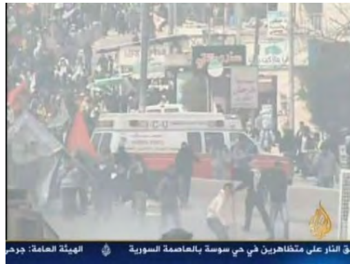
יידוי אבנים במחסום קלנדיה (אלג'זירה, 30 במרץ 2012)

צה"ל. התפילות בהר הבית, שהוגבלו לגברים מעל גיל ארבעים בעלי תעודות זהות ישראליות, הסתיימו ללא תקריות מיוחדות. כתוצאה מהתקריות באזורים השונים נפצעו עשרות רבות של פלסטינים, רובם באורח קל (בעיקר משאיפת עשן). כמו כן נפצעו שני שוטרי משמר הגבול. הנציג הפלסטיני באו"מ שלח איגרת תלונה לאו"מ על שימוש כביכול מצד צה"ל בכוח מכוון ומופרז כלפי המפגינים.