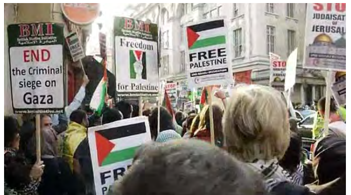
שלטים של BMI, ארגון בריטי המזוהה עם תנועת האחים המוסלמים והחמאס (youtube.com)