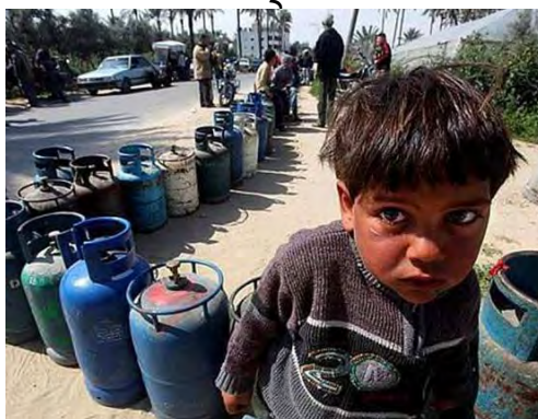
משבר הדלק ברצועת עזה (Palestine-info, 1 באפריל 2012)