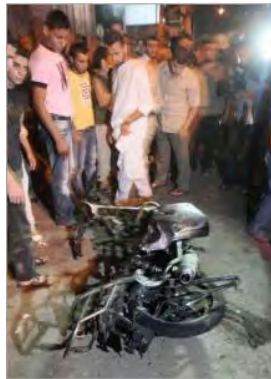
אופנוע חוליית המחבלים, שנפגע על ידי חיל האוויר (7 באפריל 2012, qudsmedia.com)