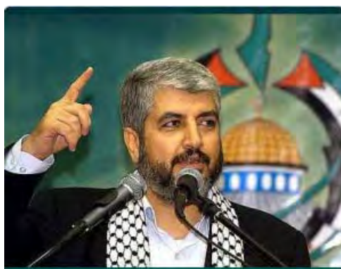
ח'אלד משעל נושא דברים בעצרת למען ירושלים (7 באפריל 2012, qudsmedia.com)

■ בנאום שנשא ח'אלד משעל , ראש הלשכה המדינית של חמאס, בעצרת למען ירושלים שנערכה בדוחה ציין, כי אדמת ירושלים "משוחה בדם השהידים". לדבריו השאיפה היא שירושלים תהיה בירת המדינה הפלסטינית והאומה האסלאמית. עוד הדגיש, כי הדרך הנכונה והיחידה להחזרת ירושלים ושחרורה היא " ההתנגדות והרוכה " (אלג'זירה, 6 באפריל 2012).