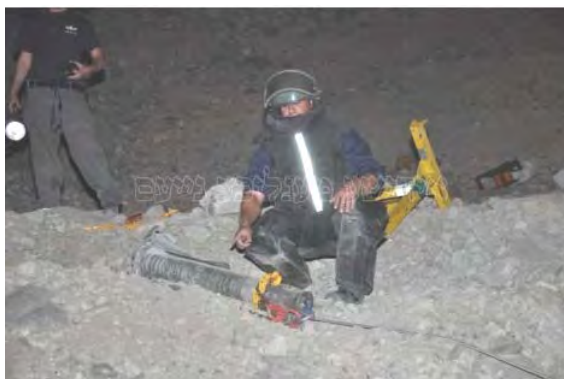
אחת הרקטות שנמצאו בעיר אילת (משטרת ישראל 5 באפריל 2012)

■ אף ארגון לא קיבל אחריות על הירי. חמאס הכחישה כל מעורבות. בהודעה רשמית שפורסמה מטעמה נאמר, כי לא ידוע על ירי של רקטות מסיני וכי הטענות של ישראל לגבי הירי הן "סוג של שקר ציוני" (אתר לשכת ההסברה של ממשל חמאס, 5 באפריל 2012). אסמאעיל הניה, ראש ממשל חמאס אמר, כי ממשל חמאס עוקב אחר הנושא ואף הדגיש בפני כל הארגונים הפלסטינים את הצורך לפעול "בתוך הגבולות הפלסטיניים בלבד" (ערוץ אלקדס, 6 באפריל 2012).