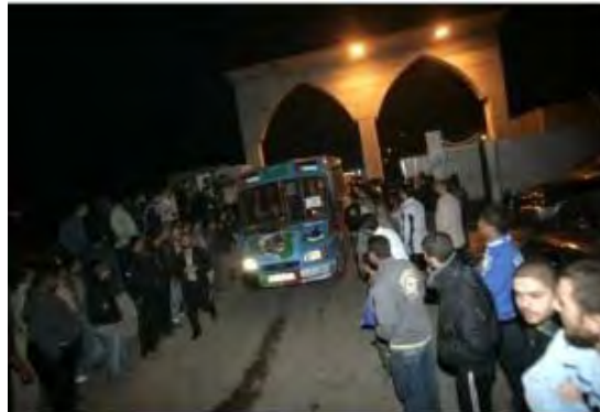
שיירת "מיילים של חיזכים 11" נכנסת לרצועת עזה דרך מעבר רפיח (5 באפריל 2012)

■ בקבלת הפנים שנערכה להם ברצועה ברך אסמאעיל הניה , ראש ממשל חמאס את משתתפי השיירה ממצרים, ירדן ולבנון והדגיש את הדבקות בזכות השיבה (ערוץ אלאקצא, 6 באפריל 2012).