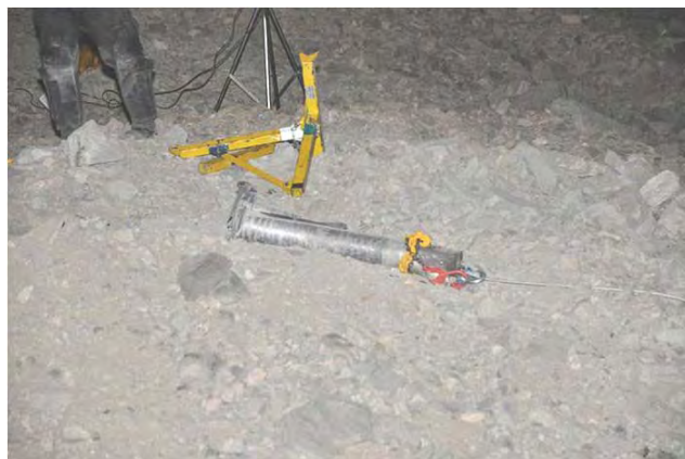
רקטת גראד 122 מ"מ, אחת מתוך שלוש, שנורו לעבר אילת מחצי האי סיני (משטרת ישראל, 5 באפריל 2012)