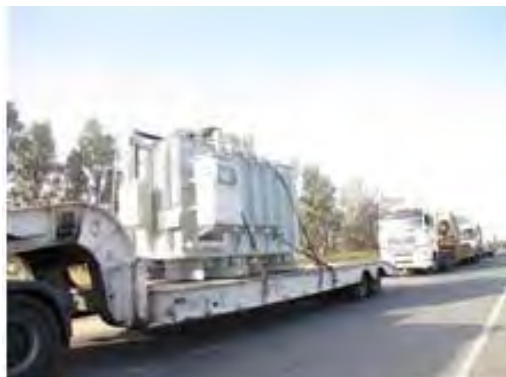
העברת שנאים מישראל לתחנת הכוח ברצועת עזה (אתר מתאם הפעולות בשטחים 9 באפריל 2012)

■ במקביל, ב-9 באפריל 2012 הועברו מישראל לרצועת עזה ארבעה שנאים עבור תחנת הכוח ברצועה. השנאים, שנתרמו על ידי ארגון UNDP, נועדו להגביר את יכולות ייצור החשמל בתחנת הכוח ברצועת עזה (אתר מתאם הפעולות בשטחים, 9 באפריל 2012).