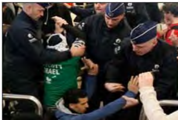
Протест антиизраильских активистов в аэропорту Шарль де Голль в Париже в связи с тем, что их не допустили к полету в Израиль