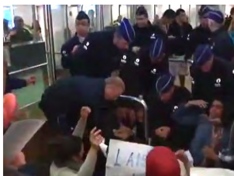
Нарушение порядка активистами в Брюсселе и их сопротивление задержанию

■ В аэропорту Бен-Гурион имели место несколько случаев незначительного нарушения порядка, которые не превратились в провокацию чрезвычайно крупного масштаба благодаря массивному присутствию израильских сил безопасности . Большую часть акций протеста осуществили активисты, посадка которых в самолет была предотвращена, в различных аэропортах Европы . Наиболее значительной была демонстрация в аэропорту Шарль де Голль в Париже – в ней приняли участие десятки активистов, которые призывали бойкотировать Израиль и выступали с нападками на авиакомпании, отказавшиеся допустить их в свои самолеты. Акции протеста (ограниченного масштаба) состоялись в аэропортах Брюсселя, Женевы и Рима . В одном случае португальский гражданин во время полета самолетом авиакомпании Jordanian Airlines нарушал порядок и был задержан при выходе из самолета.