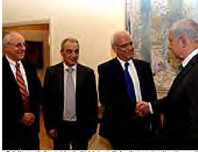
لقاء رئيس الوزراء بنيامين نتنياهو مع عصوي البعثة الفلسطينية صائب عريقات وماجد هرج (مكتب الصحافة الحكومي، 17 نيسان/أبريل 2012)