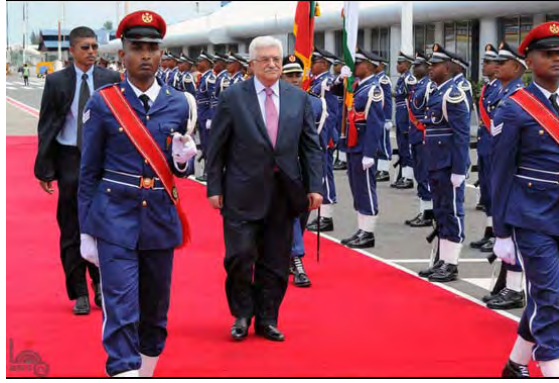
زيارة أبو مازن في جزر الملديف (وفا، 17 نيسان/أبريل 2012)

ادعى أبو مازن، خلال مؤتمر صحفي عقده في جزر الملديف التي زارها، أن المفاوضات السياسية لعملية السلام وصلت إلى طريق مسدود بسبب سياسة إسرائيل في الضفة الغربية وتنصلها من التزاماتها نحو السلام وتوسيع المستوطنات. وأشار أبو مازن على ضوء ذلك إلى أن السلطة الفلسطينية "سوف تدقّ من جديد أبواب الأمم المتحدة" بهدف الحصول على اعترافها بالدولة الفلسطينية (معاً، 16 نيسان/أبريل 2012)