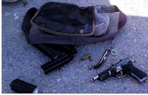
الوسائل القتالية والعبوات الناسفة التي ضبطت بحوزة المخربين (الناطقة بلسان حرس الحدود، 21 نيسان\أبريل 2012).

■ لقد لاحظ جنود من حرس الحدود في 21 نيسان\أبريل فلسطينيين في 17 من عمرهما عندما نزلا من سيارة في مفترق تفوح. وقد كان بحوزة الاثنين حفيبة أثارت شكوك أفراد الشرطة في الحاجز. وطالب أفراد الشرطة الاثنين بالتوقف ولكنهما بدأ يلوذان بالفرار. وبعد إلقاء القبض على الاثنين تبين أنّهما من سكان مخيم بلاطة حيث كان بحوزتهما أربع عبوات ناسفة ومسدس وذخيرة (الناطقة بلسان حرس الحدود، 21 نيسان\أبريل 2012).