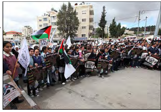
أحداث يوم السجن في رام الله (من اليمين) وفي الخليل (من اليسار) (وفا، 19 نيسان/أبريل 2012)

■ تمّ على خلفية يوم السجن واضراب السجناء الفلسطينيين في السجون الإسرائيلية عن الطعام، نقل رسائل إلى الأمين العام للأمم المتحدة ورئيسة مجلس الأمن ورئيسة الجمعية العامة. عيسى قراقع رئيس شؤون الأسرى والمحررين، بعث برسالة إلى الأمين العام للأمم المتحدة، شرح له فيها عن وضع السجناء الفلسطينيين المسجونين في إسرائيل. وأرفق قراقع طلباً في رسالته إلى الأمين العام للأمم المتحدة لتشكيل لجنة دولية لها صلاحية التحقيق في وضع السجناء (معاً، 23 نيسان/أبريل 2012).