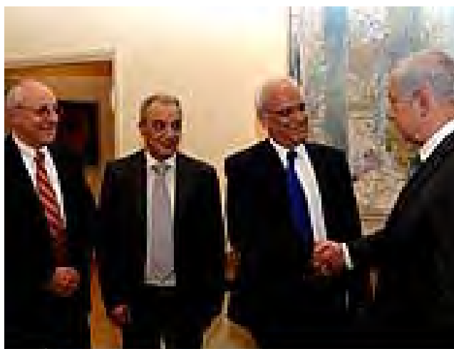
Встреча главы правительства Израиля Биньямина Нетаньягу с членами делегации Палестинской автономии Саебом Арикатом и Маджидом Фараджем (пресс-служба израильского правительства, 17 апреля 2012 года)