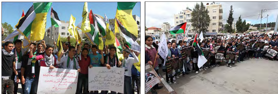
"День заключенного" в Рамалле (справа) и в Хевроне (слева)

■ В рамках мероприятий, проводимых в "День заключенного", и голодовки, устроенной палестинцами в израильских тюрьмах, были отправлены послания генеральному секретарю ООН, председателю Совета безопасности и председателю Генеральной ассамблеи. Исса Карака, министр Палестинской автономии по делам заключенных, направил генеральному секретарю ООН послание, в котором он сообщил о положении палестинских заключенных, находящихся в израильских тюрьмах. В своем послании Карака обратился к генеральному секретарю ООН с просьбой создать международную полномочную комиссию по расследованию положения палестинских заключенных в Израиле (агентство новостей Маан, 23 апреля 2012 года).