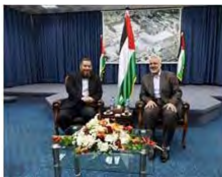
Reunión del líder del partido El Nour con Ismael Hanie durante la visita a la Franja de Gaza (Info-Palestine, 22 de abril de 2012)