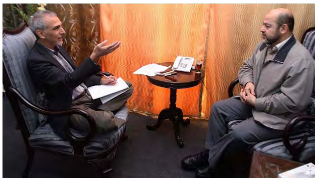
Musa Abu Marzuk en una entrevista (The Daily Jewish Forward 19 de abril de 2012)

■ Entre otras cosas dijo que Hamás no reconocerá a Israel de ningún modo , y que todo tratado de paz que sea firmado entre la Autoridad Palestina e Israel no la obligará una vez que llegue al gobierno . Como ejemplo del carácter de las relaciones que Hamás pueda establecer con Israel, mencionó Abu Marzuk las relaciones de Siria y de Libano con Israel (The Jewish Daily Forward, 19 de abril de 2012).