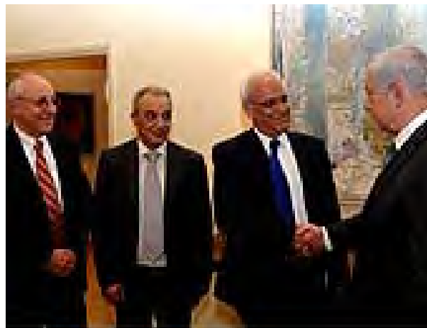
Reunión del Primer Ministro Biniamin Netanyahu con miembros de la delegación de la Autoridad Palestina: Saib Arikat y Magid Fargi (17 de abril de 2012)