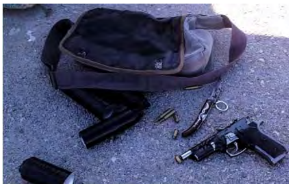
Armas y artefactos explosivos que se encontraron en poder de los terroristas (del portavoz de la Guardia Fronteriza, 21 de abril de 2012)

■ El 21 de abril, los soldados de la Guardia Fronteriza (Mishmar ha Gvul) distinguieron dos palestinos de aproximadamente 17 años de edad, cuando descendían de un taxi en el cruce Tapuj. En manos de los dos había un bolso que despertó las sospechas de los policías que estaban en la barrera del cruce. Los agentes los llamaron para que se detuvieran pero ellos comenzaron a correr para escaparse. Los dos viven en el campo de refugiados Balata, y una vez que se los detuvo se encontró en su posesión cuatro artefactos explosivos, un revólver y municiones (del portavoz de la Guardia Fronteriza, 21 de abril de 2012).