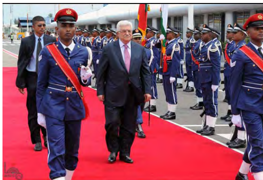
Visita de Abu Mazen a las islas Maldivas (UFA, 17 de abril de 2012)

■ A su vuelta Abu Mazen se encontró con David Hill, enviado norteamericano especial para el Medio Oriente. Los dos hablaron entre otras cosas sobre el asunto de la carta política que Abu Mazen envió a Biniamin Netanyahu. Los palestinos informaron a los norteamericanos, que esperan la respuesta israelí a la carta (El Haiat Algezira, 22 de abril de 2012).