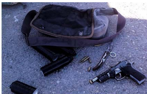
אמצעי הלחימה והמטענים שנמצאו ברשות המחבלים (דוברות מג"ב, 21 באפריל 2012)

■ ב-21 באפריל הבחינו חיילי משמר הגבול בשני פלסטינים כבני 17 כשירדו ממונית בצומת תפוח. ברשות השניים נמצא תיק שעורר את חשד השוטרים במחסום. השוטרים קראו להם לעצור אולם הם החלו להימלט. לאחר שנתפסו השניים, תושבי מחנה הפליטים בלטה, נמצאו ברשותם ארבעה מטענים, אקדח ותחמושת (דוברות מג"ב, 21 באפריל 2012).