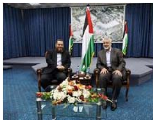
פגישת ראש מפלגת אלנור עם אסמאעיל הניה במהלך הביקור ברצועת עזה (Palestine-info, 22 באפריל 2012)