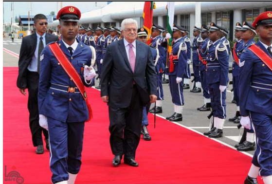
ביקור אבו מאזן באיים המלדביים (ופא, 17 באפריל 2012)

■ אבו מאזן טען, במסיבת עיתונאים, אותה קיים באיים המלדביים שם עשה בביקור, כי המשא ומתן המדיני לשלום מצוי במבוי סתום בשל מדיניותה של ישראל ביהודה ושומרון, הסתלקותה ממחויבות השלום והרחבת ההתנחלויות . לאור זאת, ציין אבו מאזן, כי הרשות הפלסטינית "תשוב ותדפק מחדש על דלת האו"ם" על מנת להשיג הכרה במדינה פלסטינית (מען, 16 באפריל 2012).