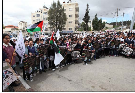
אירועי יום האסיר בראמאללה (מימין) ובחרון (משמאל) (ופא, 19 באפריל 2012)