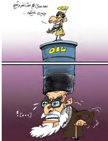
"לא יקרה שום דבר, גם אם לא נמכור נפט במשך שלוש שנים", (רוז אונליין, 11 אפריל 2012)

בשבוע שעבר קרא גם שר החוץ, עלי-אכבר צאלחי (Ali-Akbar Salehi), למערב להקל על הסנקציות הכלכליות נגד איראן לקראת חידוש המשא ומתן הגרעיני בבגדאד. בראיון לסוכנות הידיעות "איסנ"א" אמר צאלחי, כי על המערב לנקוט בצעדים בנוי אמון לקראת השיחות. סגן יו"ר ועדת המג'לס למדיניות חוץ ולביטחון לאומי, אסמאעיל כות'רי (Esmail Kowsari), הצהיר, אף הוא, כי סבב השיחות הבא בין איראן למערב צריך להתמקד בהסרת הסנקציות ובמניעת תפוצת נשק גרעיני בעולם (פארס, 21 אפריל).