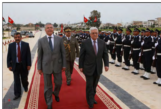
ביקור אבו מאזן בתוניס (ופא, 29 באפריל 2012)

■ אבו מאזן מקיים בימים אלה ביקור מדיני במדינות צפון אפריקה במסגרת זאת הגיע לתוניס לביקור בן ארבעה ימים. במהלך הביקור נועד אבו מאזן עם מחמד מנצף אלמרזוקי, נשיא תוניס, ודן עימו בעמדה הפלסטינית בדבר חידוש המשא ומתן עם ישראל, אפשרות חידוש פניותם של הפלסטינים לאו"ם בדרישה לקבל הכרה בינלאומית, וסוגיית הפיוס הפנים-פלסטינית (אלאיאם, 29 באפריל 2012). מתוניס צפוי אבו מאזן צפוי להמשיך ללוב.