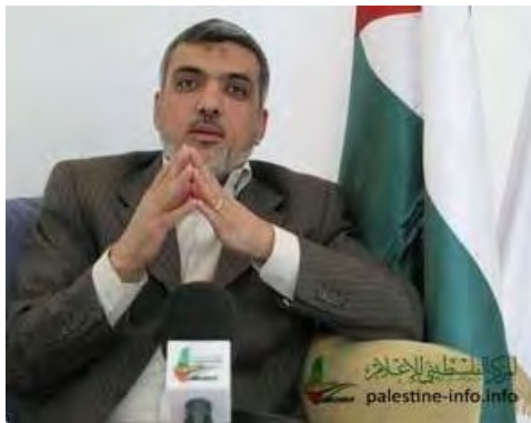
עזת רשק ( http://www.palestine-info.co.uk , 29 באפריל 2012)

■ עזאת אלרשק , חבר הלשכה המדינית של חמאס, קרא לארגוני זכויות אדם ולאמצעי התקשורת לראיין את גלעד שליט על מנת לשמוע ממנו על יחסה של הזרוע הצבאית של חמאס במהלך תקופת שהותו ברצועה. לטענתו הדבר יחשוף את הפער, שבין יחסה של חמאס כלפיו לבין יחסה של ישראל כלפי האסירים הפלסטינים (הערה: זוהי השוואה מופרכת ). מחבלים פלסטינים אסורים בישראל נאסרו בהתאם להחלטה שיפוטית, לאחר שניהלו הליך משפטי וזכו לייצוג משפטי. גלעד שליט, לעומת זאת, על פי דיווחים בתקשורת, הוחזק בבידוד ובתנאים קשים. לגלעד שליט לא הותר לקיים כל קשר עם הצלב האדום ועם העולם החיצון. כל זאת תוך התעלמות מוחלטת של חמאס מהנורמות הבינלאומיות המקובלות המבוססות, בין השאר, על אמנת ג'נבה השלישית (מ-1949).