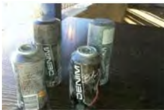
Четыре взрывных устройства, обнаруженные военнослужащими Армии Оборона Израиля на КПП Бекаот (25 апреля 2012 г.)