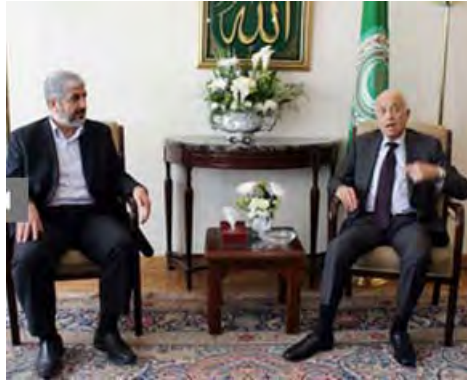
Халед Машаль провел в Египте совещание с генеральным секретарем Лиги арабских государств ( http://www.palestine-info.co.uk , 29 апреля 2012 г.)

■ Параллельно с этим из сектора Газа через КПП Рафиях в Каир отправилась с визитом делегация, в состав которой входили члены законодательного совета от Хамаса во главе с Ахмедом Бахаром. Целью этой визита было участие в переговорах между Халедом Машалем и представителями египетских служб безопасности. Из Египта делегация отправится в Бахрейн (агентство Маан, 28 апреля 2012 г.)