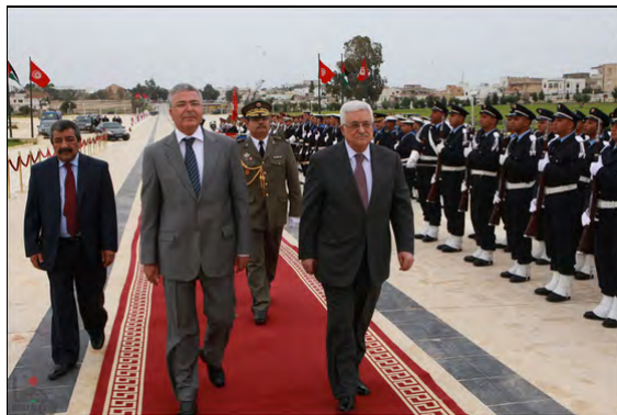
Абу Мазен во время визита в Тунис (29 апреля 2012 года)