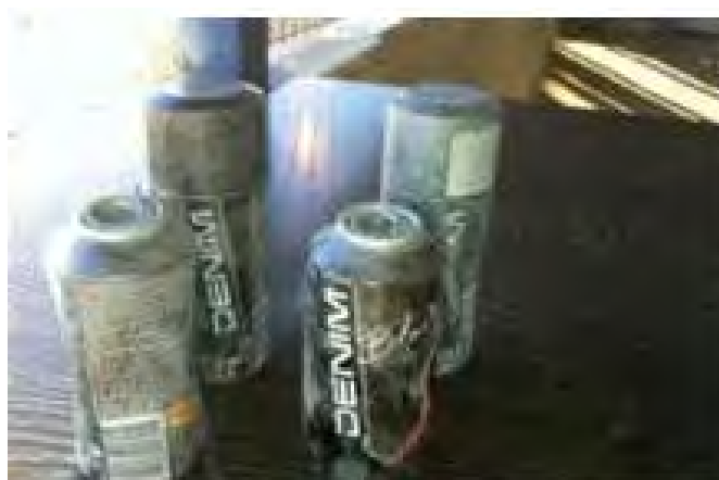
Cuatro cargas explosivas descubiertas por efectivos de Tzáhal en el paso de Beka'ot (Portavoz de Tzáhal, 25 de abril de 2012)