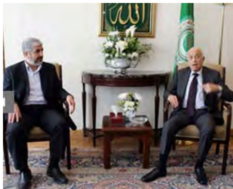
Jaled Meshal con el Secretario de la Liga Árabe ( http://www.palestine-info.co.uk , 29 de abril de 2012)