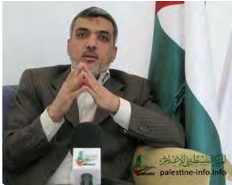
Izzat Rishq ( http://www.palestine-info.co.uk , 29 de abril de 2012)

por abogados. Gilad Shalit, según los informes de la prensa, permaneció aislado y en duras condiciones, no se le permitió ningún tipo de contacto con la Cruz Roja ni con el mundo exterior, y todo ello mientras Hamás hacía caso omiso de las normas internacionales basadas, entre otras fuentes, en la Tercera Convención de Ginebra de 1949).