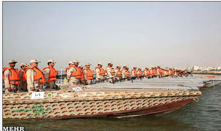
תמרון ימי איראני במפרץ הפרסי בשבוע שעבר

האתר פרארו (Fararu) טען, אף הוא, כי ערב הסעודית מנסה לקדם את האינטרסים הפוליטיים שלה באזור באמצעות האשמות שווא נגד איראן. הסעודים מנסים לשקם את יחסיהם עם מצרים, שהתערערו מאז נפילת משטר מבארכ, ולהגביר את מעורבותם במדינה זו לקראת הבחירות לנשיאות הרפובליקה. האתר גרס, כי תגובת דובר משרד החוץ להאשמות שהועלו בעיתונות הסעודית נגד איראן אינה מספקת וכי על איראן לפעול בערוצים הדיפלומטיים והמשפטיים כדי להרתיע מדינות נוספות מהפניית טענות שקריות נגד איראן. דעת הקהל הפנימית באיראן אינה מוכנה לשאת עוד את הסעודים ואת האשמותיהם נגד איראן, נכתב בפרארו (5 מאי 2012).