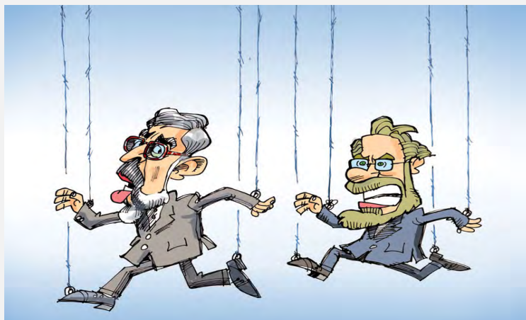
המירוץ לראשות המג'לס (רוז אונליין", 23 אפריל 2012)

היומון תהראן אמרוז (Tehran Emrooz) המזוהה עם ראש עיריית טהראן, מחמד-באקר קאליבאף (Mohammad Baqer Qalibaf), דיווח השבוע, כי חדאד עאדל זימן בשבוע שעבר ללשכתו 60 חברי מג'לס, שנבחרו בסיבוב הבחירות הראשון, במסגרת מאמציו לגייס תמיכה במועמדותו לתפקיד יו"ר המג'לס. גם לאריג'אני החל לפעול על-פי דיווח זה בקרב חברי המג'לס בניסיון להישאר בתפקידו (תהראן אמרוז, 7 מאי 2012).