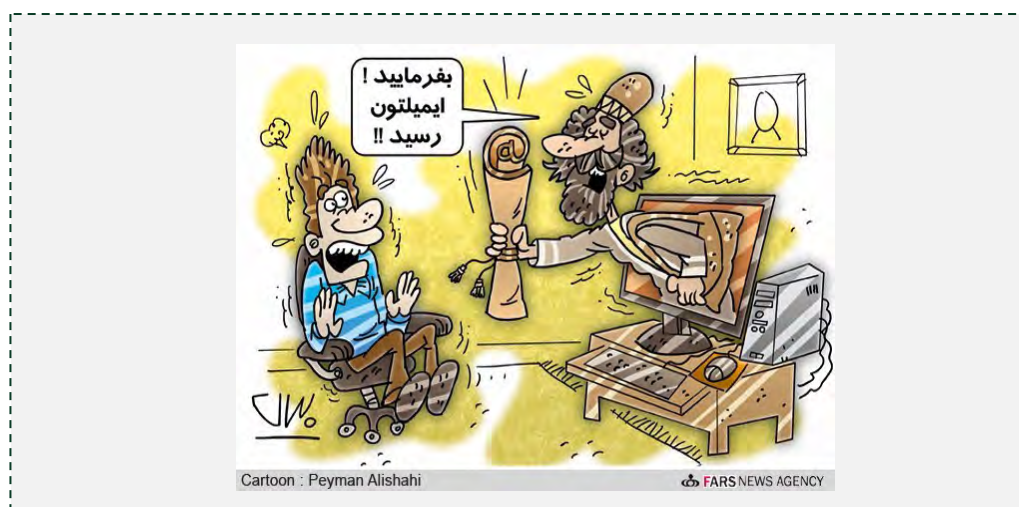
"בבקשה, המייל שלך הגיע!!"

באמצעות הדוא"ל עם גופים אלה אם לא יפתחו כתובת דוא"ל חדשה באמצעות שרת דוא"ל פנימי ( http://www.irwebnews.com/foreign-email-use-prohibited-in-bank.html , 10 מאי 2012).