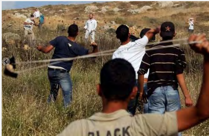
الأجهزة الأمنية تكشف خلية تخريبية كانت تنوي اختطاف مواطنين إسرائيليين 2

■ لقد نشبت في 19 أيار/مايو خلال ساعات الظهر مواجهة عنيفة بين فلسطينيين ومستوطنين من يتسهار في منطقة قرية عصيرة القبليّة (إلى الجنوب من نابلس). وقد ألقت المجموعة الفلسطينية الحجارة باتجاه المستوطنين وحتى بدأت بإضرام النار. وقد أطلق المستوطنون الطلقات المطاطية ردّاً على ذلك. وقد جرح عدد من الفلسطينيين جرّاء المواجهة. (Ynet, 21 أيار/مايو 2012).