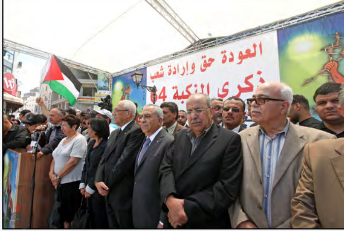
قيادة السلطة الفلسطينية في مراسم إحياء ذكرى يوم النكبة في رام الله وعلى اللافتة المعلقة في الخلفية مكتوب: "العودة حق وإرادة الشعب" (وفا , 15 أيار/مايو 2012)