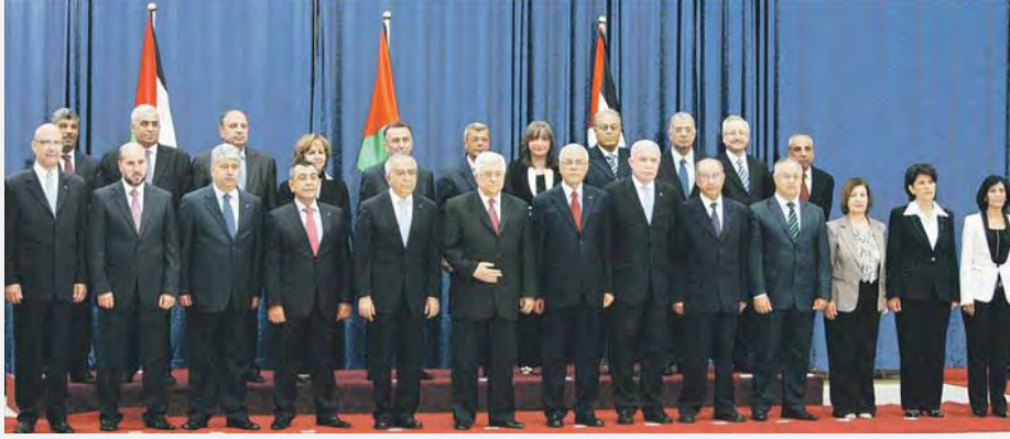
الحكومة الفلسطينية الجديدة (الخليج 17 أيار/مايو 2012)