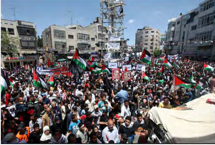
مهرجان "يوم النكبة" في رام الله (وفا، 15 أيار/مايو 2012)