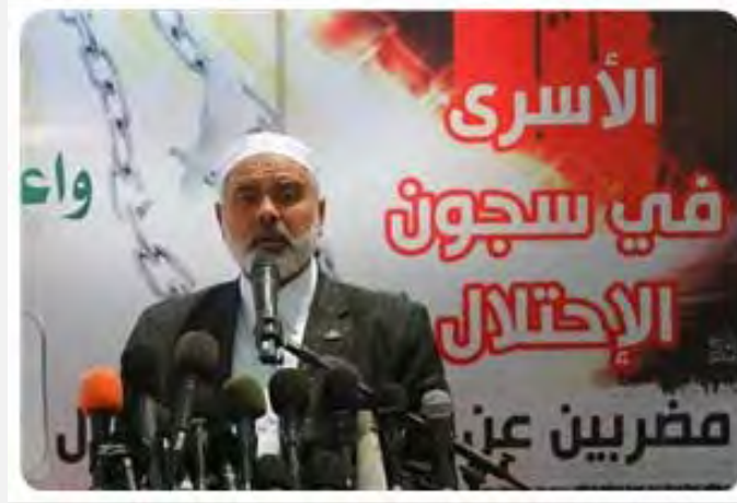
اسماعيل هنية يهنئ نشطاء القوافل (17 أيار/مايو 2012)