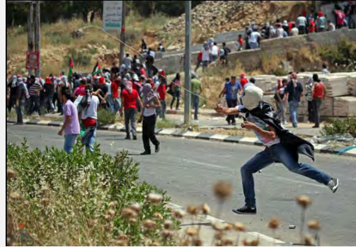
مواجهات وعمليات إخلال بالنظام خلال "يوم النكبة" في رام الله (وفا، 15 أيار/مايو 2012)