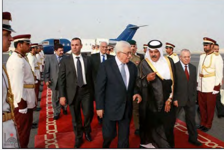
أبو مازن عند وصوله إلى الدوحة (19 أيار/مايو 2012)

■ وصرّح أبو مازن خلال زيارته إلى القاهرة أنّه في حال عدم حصول القيادة الفلسطينية على ردّ إيجابي من إسرائيل بالنسبة لاستئناف المفاوضات على أساس الشرعية الدولية ووقف البناء في المستوطنات سوف يضطر للتوجّه إلى الأمم المتحدة للحصول على مكانة دولة دائمة العضوية في الأمم المتحدة ومنظماتها المختلفة. وأضاف أبو مازن قائلاً إنّه واثق من أنّ الفلسطينيين سيحصلون على عضوية مؤقتة بسهولة كبيرة لأنهم يحظون بغالبية في مجلس الجمعية العامة تسمح لهم بالحصول على ذلك (الشرق الأوسط، 20 أيار/مايو 2012).