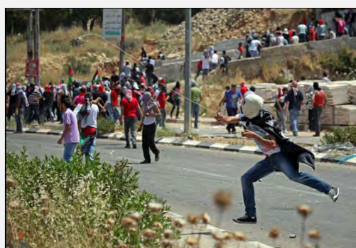
עימותים והפרות סדר ב"יום הנכבה" בראמאללה (ופא, 15 במאי 2012)