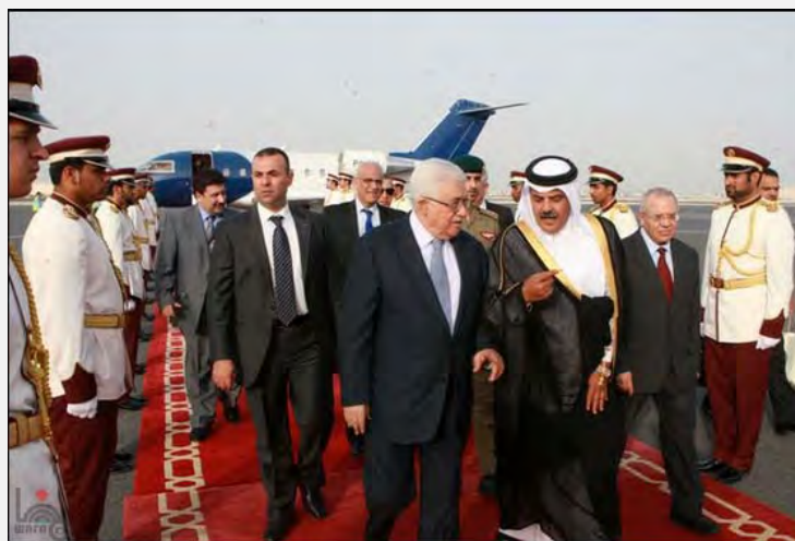
אבו מאזן בעת הגעתו לדוחה (, 19 במאי 2012)

■ אבו מאזן, ראש הרשות הפלסטינית, סייר בירדן, מצרים וקטר על מנת לדווח על תוכן אגרת התשובה של ראש הממשלה נתניהו, אשר לדבריו "לא עמדה בדרישות המעשיות לחידוש המשא ומתן" (אלשרק אלאוסט, 20 במאי 2012).