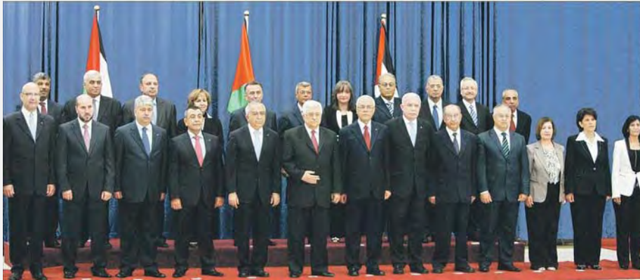
הממשלה הפלסטינית החדשה (אלחליג' 17 במאי 2012)