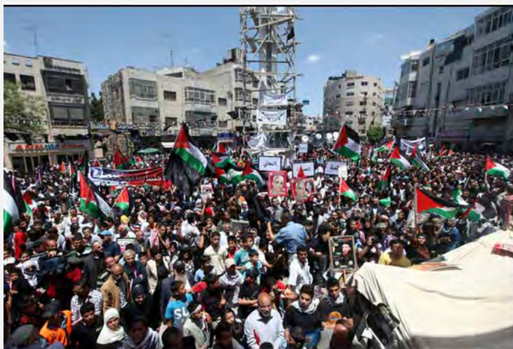
עצרת "יום הנכבה" בראמאללה (ופא, 15 במאי 2012)