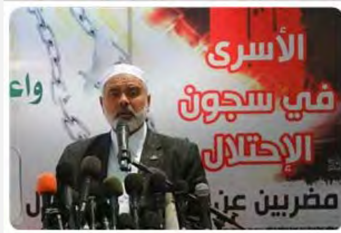
אסמאעיל הניה מברך את באי השיירות (17 במאי 2012)

■ בטקס קבלת הפנים לשיירות הודה אסמאעיל הניה, לבאים והדגיש את מועד הגעתן ב"יום הנכבה" ובמקביל ל"ניצחון האסירים". הניה ציין בדבריו, כי "אדמת פלסטין אינה שייכת לפלסטינים בלבד אלא גם לערבים ולמוסלמים". עוד הוסיף, כי במהלך ההיסטוריה בכל פעם שאדמת פלסטין הייתה תחת כיבוש לבסוף היא שוחררה (ערוץ אלאקצא, 18 במאי 2012).