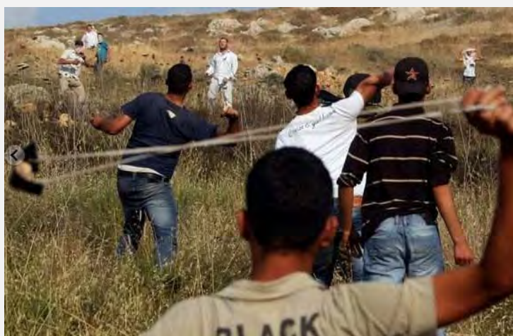
עימות אלים בין מתנחלים לפלסטינים (20 במאי 2012)

■ ב-19 במאי בשעות אחר הצהריים פרץ עימות אלים בין פלסטינים למתיישבים מיצהר באזור הכפר עצירה קבליה (דרומית לשכם). קבוצה של פלסטינים החלה ליידות אבנים לעבר קבוצה של מתנחלים ואף להצית אש. בתגובה ירו המתנחלים לעבר הפלסטינים כדורי גומי. כתוצאה מהעימות נפצעו מספר פלסטינים (Ynet, 21 במאי 2012).