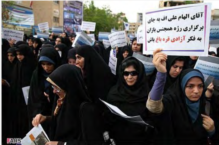
מפגינים איראנים בתבריז. על השלט הנשיא על-ידי המפגינה נכתב: "מר אלהאם עליאף [אלהאם אלייב, נשיא אזרביג'אן], במקום לקיים מצעד ההומוסקסואלים, תחשוב כיצד לשחרר את [חבל] קרבאך"