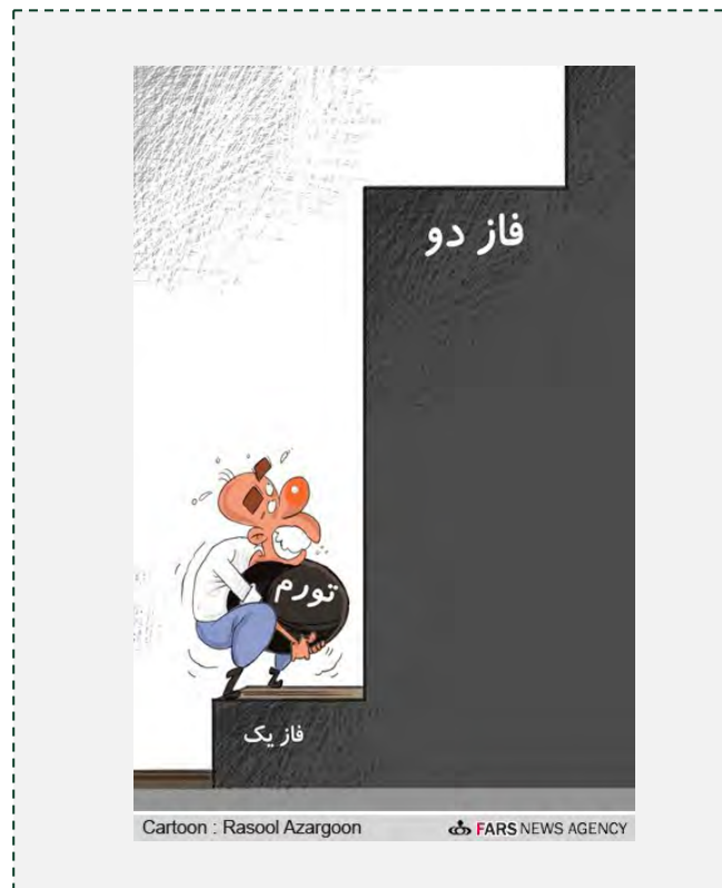
משא ה"אינפלציה" במעבר מ"שלב 1" (ברפורמה בסובסידיות) ל"שלב 2"

הכלכלן הבכיר הזהיר, כי אם הממשלה תמשיך ביישום התוכנית, ימשיכו המחירים לעלות ושיעור הצמיחה הכלכלית ימשיך לרדת. הוא ציין, כי הממשלה צריכה לנקוט במספר צעדים מקדימים, שישפרו את המצב הכלכלי ויגדילו את הכנסותיה, בטרם תמשיך בביצוע התוכנית. על הממשלה להגדיל את התמיכה בשכבות החלשות ולבצע את הרפורמה באופן הדרגתי במשך 5 שנים לפחות, כיוון שתשלום קצבאות לאזרחים לא יספיק למניעת הפגיעה הנמשכת באזרחים. סאסאן העריך, כי יישום מדורג של הרפורמה יאפשר, בין היתר, לאזרחים לעבור לשיטות הסקה חדשות המבוססות על מערכות סולאריות במקום על מקורות אנרגיה מסורתיים ולמפעלים לעבור לייצור המבוסס על מערכות חסכוניות באנרגיה. תהליכים אלה יאפשרו, לדבריו, לצמצם את השפעות עליית מחירי הדלק כתוצאה מהרפורמה במדיניות הסובסידיות (מרדם סאלארי, 20 מאי 2012).