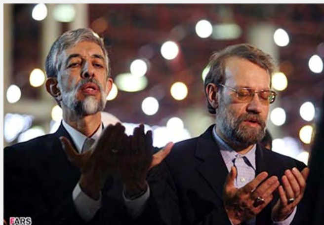
המנצח והמפסיד: לאריג'אני (מימין) וחדאד-עאדל (משמאל)

יו"ר המג'לס השמיני, עלי לאריג'אני, נבחר השבוע לתפקיד יו"ר המג'לס התשיעי, שהחל השבוע את מושבו הראשון לאחר הבחירות. בהצבעה, שהתקיימה ביום שני (28 מאי), גבר לאריג'אני על על-אם-עלי חדאד עאדל (Gholam-Ali Haddad Adel), ששימש כיו"ר המג'לס השביעי. לאריג'אני זכה בתמיכת 173 מבין 275 חברי המג'לס, שהשתתפו בהצבעה, לעומת 100 חברי מג'לס שתמכו במועמדותו של חדאד עאדל. בשלב זה נבחר לאריג'אני כיו"ר זמני עד להשלמת מספר הליכים ניהוליים (פרוצדוראליים), שנועדו לאשר סופית את הליך בחירתם של חברי המג'לס. לתפקיד שני סגני יו"ר המג'לס נבחרו מחמד-רזא באהנר (Mohammad-Reza Bahonar) ומחמד חסן אבו-תראבי פרד (Mohammad Hassan Abu-Torabi Fard), שניהנו בתפקידים אלה גם במג'לס הקודם.