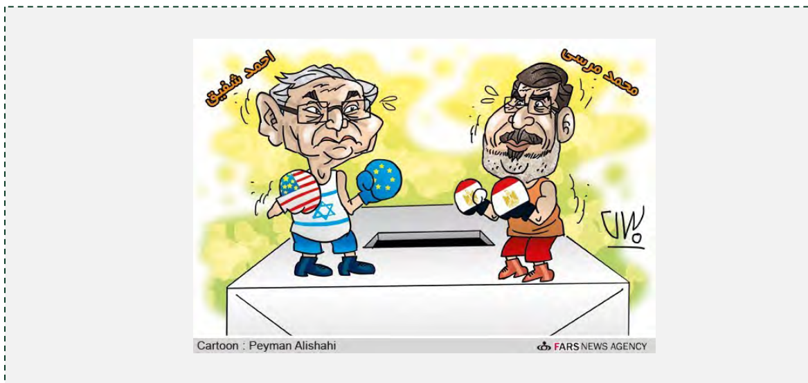
מחמד מרסי נגד אחמד שפיק

היומון ג'מהורי-י אסלאמי (Jomhuri-ye Eslami) טען, כי תוצאות הבחירות מבטאות את האיום הגדול שעדיין נשקף מצד שרידי המשטר הרודני על הישגי המהפכה. מתוצאות הבחירות עולה, כי מחצית מהבוחרים הצביעו עבור מועמדים, שלא היו שותפים למהפכה. גם אם האחים המוסלמים יזכו בבחירות, אין בכך כדי להסתיר את התמיכה הניכרת במועמדים, שהתנגדו לאסלאמיסטים ושחלקם אף תמכו בשרידי המשטר הרודני הישן. הדבר מצביע על כך, שהמשטר הרודני אינו מבוסס על אדם אחד אלא על קבוצת אנשים המשתפים ביניהם פעולה. אחמד שפיק ועמרו מוסא היו חלק מהמנגנון הרודני נגדו התקומם העם המצרי, אך שרידי הדיקטטורה עדיין מצליחים להריץ מועמדים ולהתמודד בבחירות לנשיאות.