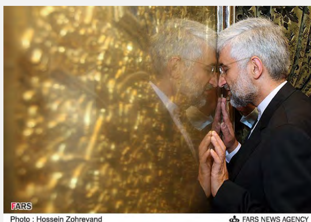
סעיד ג'לילי בכרבלאא' לאחר סיום השיחות בבגדאד

חרף המחלוקות הסכימו שני הצדדים לשוב ולהיפגש ובשעות אחר הצהריים של יום הדיונים הראשון דיווחה התקשורת האיראנית, כי המשך השיחות התנהלו באווירה חיובית יותר וכי נציגי המערב הסכימו לדון בהסרת הסנקציות, לאחר שהגיעו למסקנה, כי עדיף לנקוט בצעדים בוני אמון כלפי איראן (פארס, 24 מאי 2012). בתום סבב השיחות סוכם על סבב נוסף, שייערך במוסקבה ב-18-19 בחודש יוני. במסיבת עיתונאים, שהתקיימה בתום השיחות, הצהיר ראש המשלחת האיראנית, סעיד ג'לילי, כי איראן התעקשה על זכותה להמשיך בהעשרת אורניום ולקיים מעגל דלק גרעיני מלא. הוא שב וציין, כי איראן עמדה בהתחייבויותיה בהתאם לאמנה למניעת תפוצת נשק גרעיני (NPT) וכי אסטרטגיית הלחצים של המערב הגיעה לסוף דרכה. הוא הוסיף, עם זאת, כי קיימת אפשרות להגיע לפשרה בנוגע להעשרת האורניום לרמה של 20%.