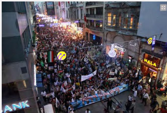
La marcha en la plaza de ceremonias (sitio de IHH 3 de junio de 2012)

■ El 31 de mayo se realizaron en Estandul eventos en conmemoración del aniversario de los sucesos de “Mavi Mármara”. El evento central fue una marcha realizada en la plaza de ceremonias que está en el centro de Estandul. Según el sitio de la organización IHH participaron en el evento una 30 mil personas. Los participantes llevaban pancartas en memoria de los muertos, pancartas de identificación con los palestinos así como pancartas en contra del presidente de Siria, Bashar Assad.