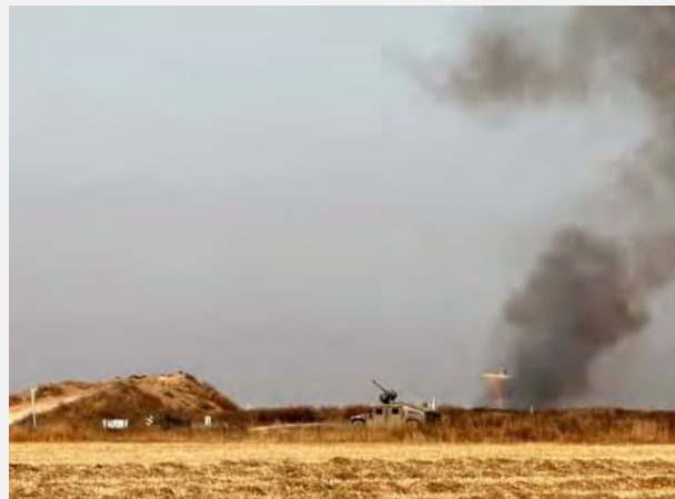
Zona del enfrentamiento en el centro de la Franja de Gaza adyacente a Kisufim (NRG, 1 de junio de 2012. Fotógrafo : Iehuda Lajiani)

■ . De la investigación del evento se concluye que el terrorista cortó la valla de seguridad y penetró en el territorio de Israel donde se quedó escondido en acecho esperando la llegada de una fuerza de Tza"hal a la región. El terrorista sorprendió a la unidad comenzando con los disparos por los que murió el soldado. Los soldados dispararon en contra del terrorista y lo mataron. El terrorista llevaba consigo armamento y en particular un rifle Kalachnicov, municiones y granadas de mano. Es posible que dicho armamento fuera para realizar un atentado en alguna de las poblaciones que se encuentran adyacentes a la valla de seguridad.