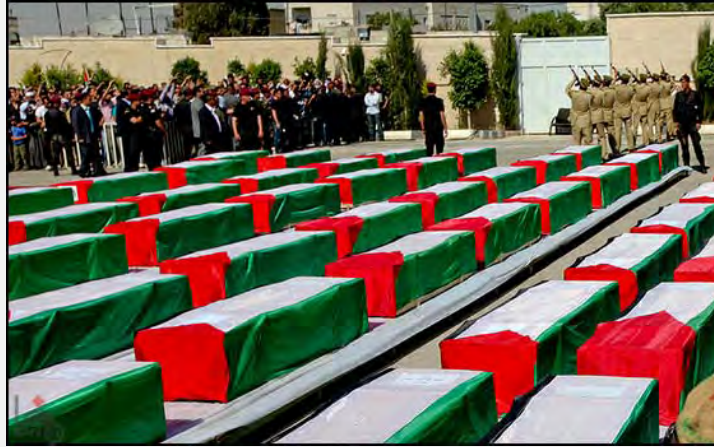
Los ataúdes de los terroristas en la explanada de Amukatah en Ramallah

se realizó una ceremonia oficial con la participación de Abu Mazen, miembros de la conducción de la Autoridad palestina y familias de los muertos (WAFA, 31 de mayo 2012).