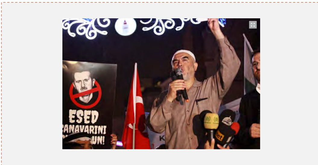
El Jeque Raed Salah en su discurso durante la ceremonia en Estambul (sitio de IHH 3 de junio de 2012)

■ Raed Salah jefe de la facción norte del movimiento islámico en Israel, que participó de los mencionados eventos, dijo que “los asesinos israelíes se ahogarán en sangre y lágrimas”. Según sus palabras “Israel terrorista y conquistadora perdió en la guerra contra Gaza a pesar del armamento moderno en su poder” y también agregó que “Mavi Mármara” saldrá a navegar muchas veces más para liberar Damasco, Hamez Hamas y Gaza.