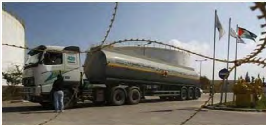
Camión de combustible en su camino hacia la Franja de Gaza.

■ La autoridad para el tránsito en la Franja de Gaza informó que el gobierno de Egipto aún no ha autorizado el traslado del combustible que llegó desde Cádiz, a la Franja de Gaza. Según la autoridad es posible que el permiso sea otorgado el 7 de junio para el traslado por el paso Kerem Shalom. El gobierno egipcio adjudica el atraso a "cuestiones técnicas". Por su parte, Israel ya autorizó la entrada de los camiones por el paso mencionado. (Sitio de los Escuadrones Iz al Din Al qassam)