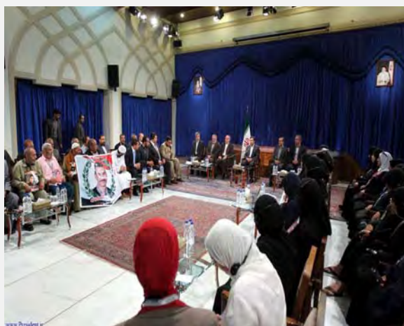
הנשיא אחמדינז'אד בפגישה עם משפחות החללים המצרים

בתוך כך הצהיר השבוע הנשיא אחמדינז'אד, כי העם האיראני ימשיך לתמוך בעם המצרי במאבקו למען חירות וצדק עד למימוש כל יעדיו. בפגישה עם בני משפחותיהם של הרוגי המהפכה המצרית אמר אחמדינז'אד, כי שיתוף פעולה בין מצרים ואיראן יביא לחיסול שליטתם של אויבי האסלאם ו"המשטר הציוני" גם ללא צורך במלחמה. די בידיעות על אחדות אפשרית בין איראן למצרים כדי להפחיד את הציונים ולגרום להם להימלט מהאיזור, אמר אחמדינז'אד (אירנ"א, 16 יוני 2012).