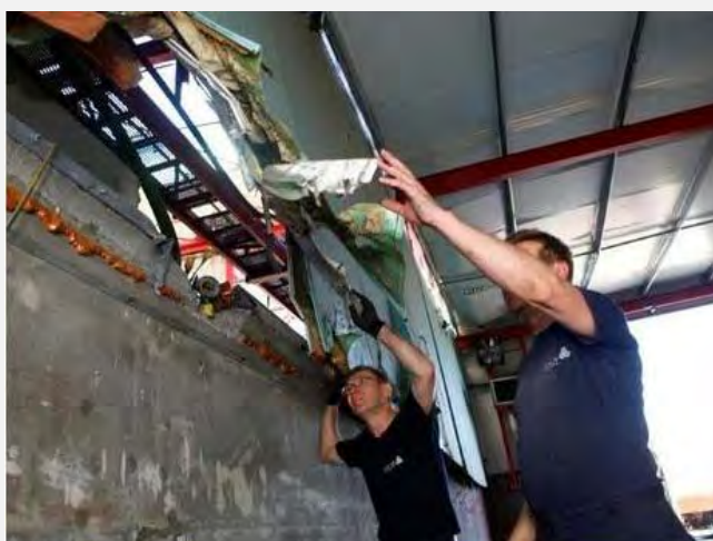
Daños al edificio de la fábrica en Sderot (NRG, 23 de junio de 2012; fotografía: Edy Israel)