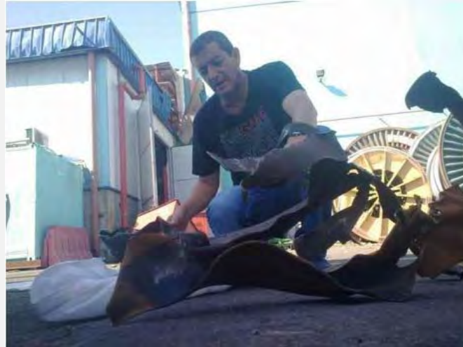
Restos de un cohete en las inmediaciones de Sderot (NRG, 23 de junio de 2012; fotografía: Edy Israel)