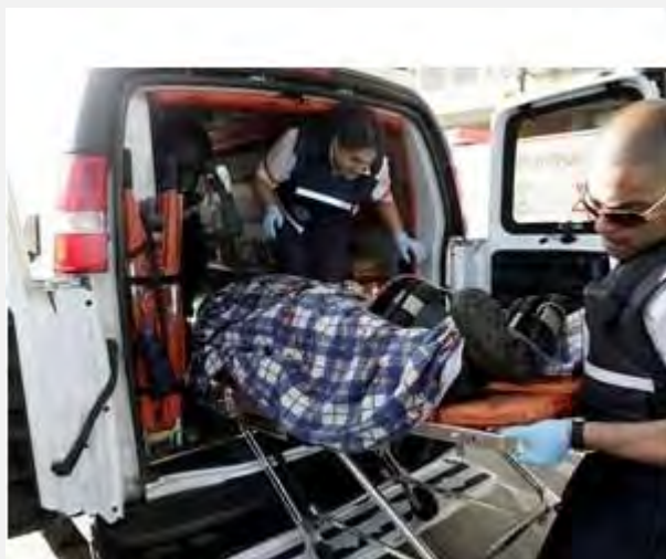
Personal de Maguen David Adom atiende al herido de la fábrica de Sderot (NRG, 23 de junio de 2012; fotografía: Edy Israel)