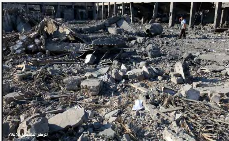
Resultados de un ataque de la Fuerza Aérea (Palestine Info, 23 de junio de 2012)