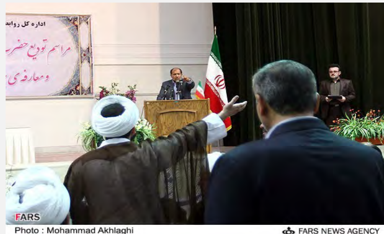
העימות בין שר הפנים למפגין במהלך טקס חילופי המושל