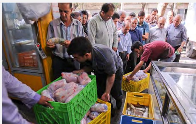
אזרחים בתור לקניית עוף בפיקוח ממשלתי

סוכנות הידיעות מהר (Mehr) דיווחה השבוע, כי עליות המחירים הנמשכות של מוצרי היסוד גורמות לכך, שהוצאותיה של משפחה איראנית ממוצעת לטובת רכישת מוצרי מזון עולות בהרבה על הכנסותיה. הסוכנות חישה ומצאה, כי משפחה בת 4 נפשות אינה מצליחה לעמוד בהוצאותיה החודשיות גם אם שני בני הזוג עובדים ומשתכרים 400 אלף תומאן בחודש (כ-325 דולרים). הכנסתה של משפחה איראנית ממוצעת הצורכת 2 ק"ג בשר, 5 ק"ג עוף, 10 ק"ג אורז, 10 בקבוקי חלב, 5 חבילות חמאה, 60 כיכרות לחם, 10 ק"ג ירקות ו-60 ק"ג פירות אינה מספיקה לרכישת מוצרים בסיסיים אלה, כיוון שק"ג בשר עולה 25 אלף תומאן, ק"ג עוף עולה 5,000 תומאן, ק"ג אורז עולה 2,500 תומאן, בקבוק שמן עולה 3,500 תומאן, ק"ג פירות עולה בממוצע 2,500 תומאן, כיכר לחם עולה 600 תומאן, ק"ג ירקות עולה 1,000 תומאן, בקבוק חלב עולה 1,500 תומאן, חבילת חמאה עולה 2,400 תומאן ויוגורט עולה 2,000 תומאן. משמעות הדבר היא, כי משפחות רבות אינן מסוגלות להזין את עצמן בצורה טובה ובני המשפחה עלולים לסבול ממחסור בוויטמינים.