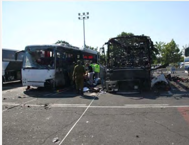
El autobús carbonizado en la escena del atentado en el aeropuerto de Burgas (fotografía: portavoz de ZAKA, 19 de julio de 2012)