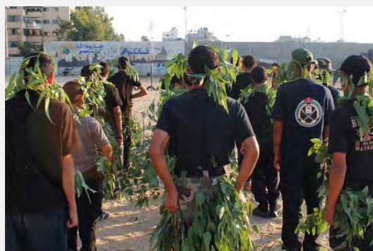
Chicos del campamento de verano de los Boy Scouts realizan entrenamientos semi-militares (Paldaf, 22 de julio de 2012)