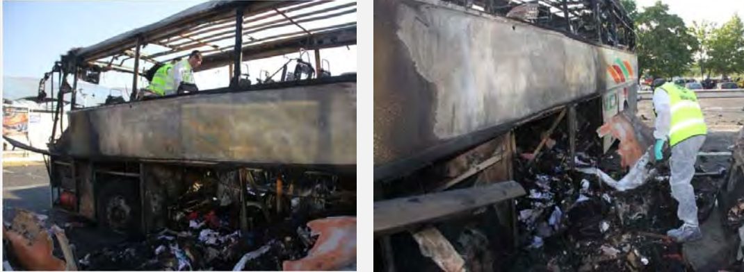
El atentado de Hezbollah en Bulgaria: restos del autobús en el aeropuerto de Burgas (Fotografía: Portavoz de ZAKA, 19 de julio de 2012)