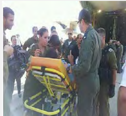
Las delegaciones de ayuda de Israel operando en Bulgaria (Portavoz de Tzáhal, 18 de julio de 2012)