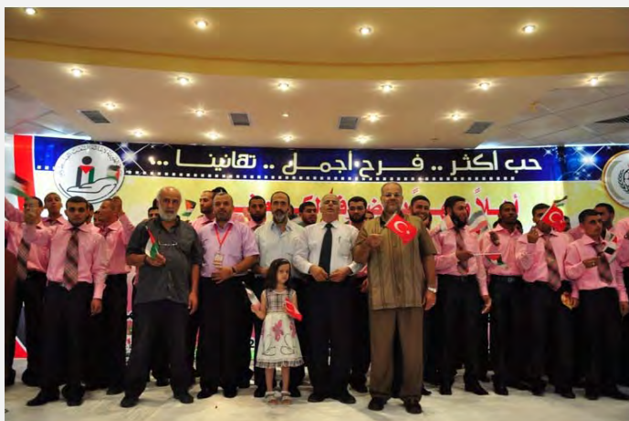
Casamiento masivo de la Yihada islámica en Palestina subsidiado por IHH. En la foto vemos a la derecha el logo de IHH y se agitan banderas de Turquía (PalToday, 17 de julio de 2012)