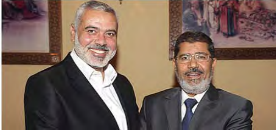
אסמאעיל הניה, ראש ממשל חמאס, בפגישתו הראשונה עם מחמד מרסי, נשיא מצרים (29 ביולי 2012, http://www.qassam.ps )