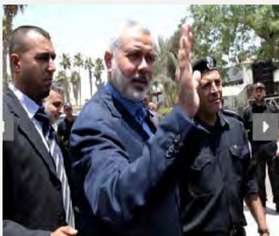
אסמאעיל הניה במעבר רפיח בדרכו לביקור במצרים ( http://www.qassam.ps , 29 ביולי 2012)