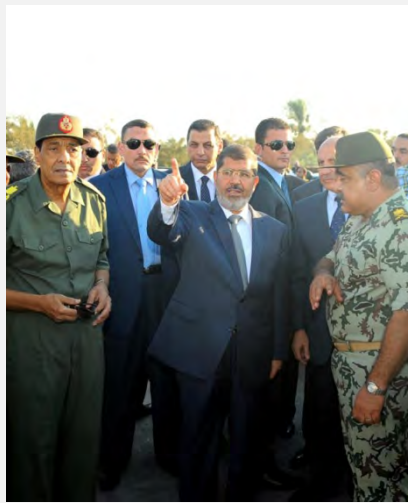
Muhammed Mursi visita El Arish (hoja Facebook de Mursi, 7 de agosto de 2012)

■ El presidente de Egipto Muhammed Mursi declaró tres días de duelo y funerales militares para los muertos. Así mismo se reforzaron los mecanismos de seguridad y de las fuerzas del ejército egipcio destacas en la península de Sinai. El 6 de agosto en horas del mediodía Mursi acompañado por el Ministro de Defensa Tantawi y el Comandante en Jefe de las fuerzas Armadas de Egipto, llegaron a El Arish para visitar a la unidad de la guardia fronteriza que fue la dañada y para seguir de cerca las investigaciones que se están realizando allí. (al Wafd, 6 de agosto de 2012).