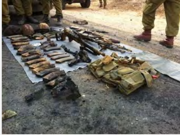
El armamento encontrado en poder de los terroristas que murieron.