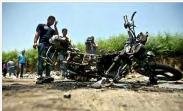
La motocicleta atacada sobre la que montaban dos activistas terroristas. (5 de agosto de 2012, http://www.alwatanvoice.com )