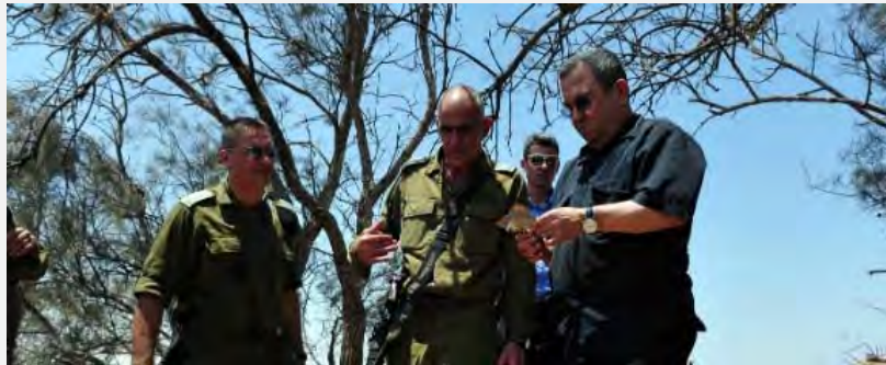
El Ministro de Defensa, Ehud Barak, patrullando en el lugar del atentado. (Ministerio de Defensa, 6 de agosto de 2012)

■ Según el portavoz de Tzáhal las informaciones concretas de inteligencia en las que se basaron el departamento de inteligencia y los servicios generales de seguridad fueron los que permitieron frustrar la penetración del grupo de terroristas en el territorio de Israel (Portavoz de Tzáhal, 5 de agosto de 2012). Como consecuencia de estos eventos se hizo una valoración de la situación bajo la dirección del Comandante en Jefe de las Fuerzas Armadas. El pasaje Kerem Shalom quedó cerrado debido al atentado y en el sistema de defensa se piensa reconsiderar en los próximos días los arreglos de defensa en el pasaje, que es un conducto para el paso de mercaderías desde Israel hacia la Franja de Gaza.