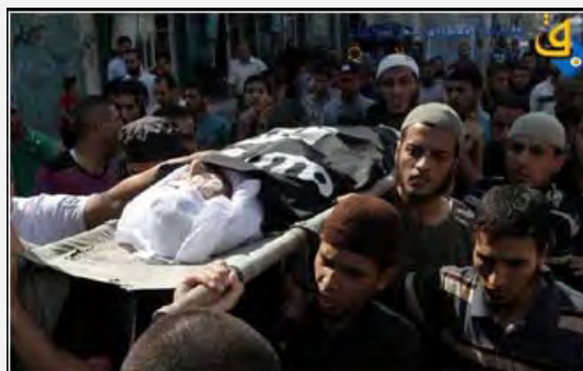
A la derecha: funerales del terrorista muerto. Su cuerpo está cubierto con una bandera de Al-Qaeda (6 de agosto de 2012) . A la izquierda : la foto del terrorista muerto (6 de agosto de 2012)