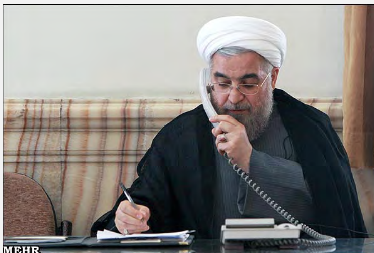
ד"ר חסן רוחאני

היומון טען, כי לא זו בלבד שרוחאני ממשיך להצדיק את התנהלותו הבלתי-נבונה, שניתן לכנותה אף כ"בגידה", אלא שהוא אף מתגאה בה וטוען, שכל הבעיות בפניהן ניצבת איראן נובעות מכך, שלא המשיכו במדיניותו. הטענות הנשמעות מצד רוחאני ותומכיו בניגוד להצהרותיו של המנהיג העליון השוללות ויתורים ותומכות בהמשך התקדמות בתוכנית הגרעין מהוות, לטענת היומון, ביטוי לתוכנית כוללת מצד אויבי איראן. תוכנית זו כוללת מספר שלבים: הגברת הלחץ מצד המעצמות הזרות על אזרחי איראן לקראת סיום תקופת כהונתה של הממשלה הנוכחית, העצמת הבעיות והדגשת הסכנות והאיומים (כולל סכנת המלחמה) הניצבים בפני איראן, ניסיון לשכתב את ההיסטוריה ולהציג את תקופת הרפורמה כתקופה שהתאפיינה בביטחון וברגיעה, העלאת הטענה שהדרך היחידה להצלת המדינה היא באמצעות חזרה למדיניות הקודמת, הרצת מועמד אפשרי לקראת הבחירות לנשיאות שיוצג כ"מושיע" והשבת תיק הגרעין לנקודת ההתחלה, כלומר: השעיה מחודשת של העשרת האורניום לצורך "בניית אמון" מול המערב (איראן, 29 יולי 2012).