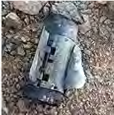
Restos de uno de los cohetes Grad que fueron disparados hacia Eilat desde la península de Sinai (portavoz de la policía, 17 de agosto de 2012)