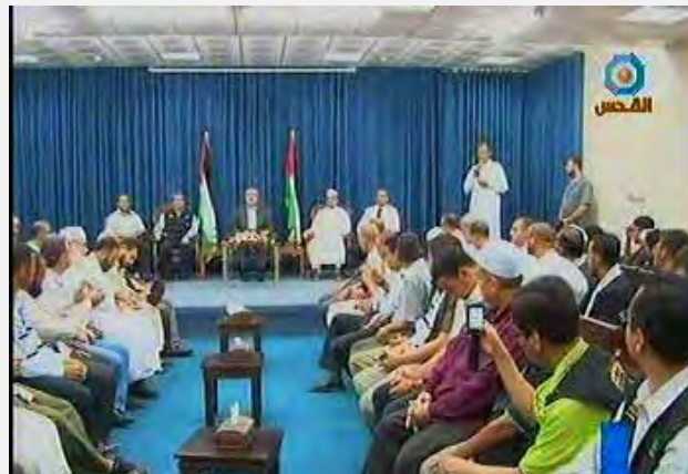
La delegación “correos de sonrisas 15” es recibida en la Franja de Gaza por Ismail Hanyie (canal al Quds, 15 de agosto de 2012)