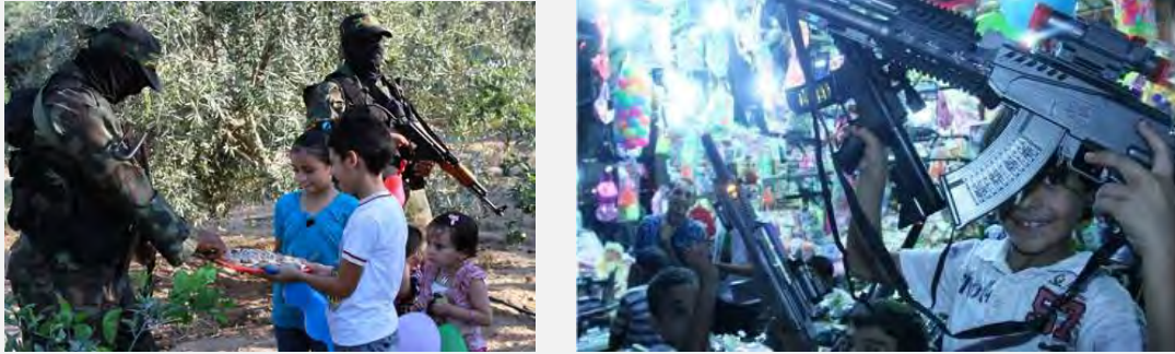
A la derecha: armamentos de juguete para los chicos en los mercados de Gaza en vísperas de la fiesta (Filastin al an, 16 de agosto de 2012). A la izquierda: chicos que visitan a los activistas del brazo militar de la Yihada Islámica en Palestina (sitio de los escuadrones de Jerusalén, 19 de agosto de 2012)