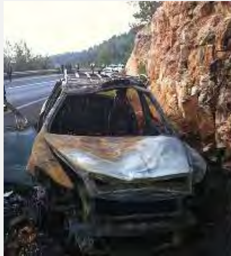
El taxi palestino contra el cual se arrojó una bomba molotov