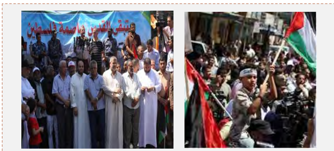
Eventos del día de Jerusalén en la Franja de Gaza, a la derecha: procesión a lo largo y ancho de la ciudad de Gaza (Palestin-info, 17 de agosto de 2012). A la izquierda : algunos funcionarios importantes de la Franja de Gaza en la procesión del día de Jerusalén (Pal Today, 17 de agosto de 2012)

■ Como todos los años, también este año durante el último viernes del mes de Ramadán se realizaron eventos del día de Jerusalén por iniciativa de Irán. En Judea y Samaria no se informó sobre los eventos que se realizaban para la celebración de ese día. También en la Franja de Gaza los eventos se realizaron con un perfil relativamente bajo sin la presencia de muchas figuras importantes del gobierno de Hamás. Después de las oraciones del viernes en las mezquitas, las organizaciones palestinas (a excepción de Fatah), realizaron una procesión en la que participaron algunos cientos de personas, que salieron de las mezquitas de la ciudad de Gaza hacia el centro de la ciudad. (Maan, 17 de agosto de 2012)