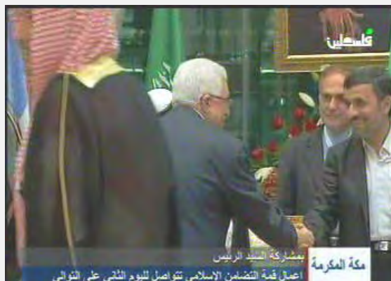
Abu Mazen en un apretón de manos con Ahmadinejad, durante la reunión cumbre urgente en Meca (canal de TV palestino, 14 de agosto de 2012)