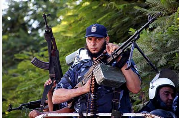
تشيط يحمل سلاحاً في مسيرة أجهزة الأمن في قطاع غزة (فلسطين الآن، 1 أيلول/سبتمبر 2012)

■ نظمت وزارة الداخلية في حكومة حماس مسيرة عسكرية في شوارع قطاع غزة شارك في رجال الشرطة والأجهزة الأمنية. وكان الهدف وزراء هذه المسيرة ابراز جاهزية اجهزة الأمن والشرطة في الدفاع عن السكان في الجبهة الداخلية (الرسالة. نت، 1 أيلول/سبتمبر 2012).