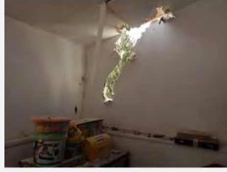
إصابة بيت مباشرة جراء سقوط صاروخ في مدينة سديروت (NRG, 31 آب أغسطس 2012, تصوير: إدي يسرائيل):