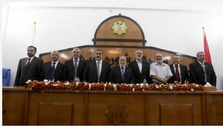
سبعة الوزراء الجدد في حكومة حماس (الرسالة، 4 أيلول/سبتمبر 2012)

■ أعلن اسماعيل هنية في 2 أيلول/سبتمبر وبعد مصادقة المجلس التشريعي في قطاع غزة عن تشكيل حكومة جديدة برئاسته في قطاع غزة. وتضمّ الحكومة 14 وزيراً، بينهم سبعة وزراء جدد. وتمّ في الحكومة الجديدة استبدال عدد من الوزراء واستحداث وزارات جديدة لم تكن قائمة بشكل رسمي أو أنها اديرت على يد وزراء كانوا يديرون أكثر من وزارة واحدة. إنّ غالبية الوزراء الجدد هم من التكنقراط، أصحاب وظائف كبيرة في الجامعة الإسلامية في قطاع غزة والتي تعتبر معقلاً لحماس (قناة الأقصى، 2 أيلول/سبتمبر 2012).