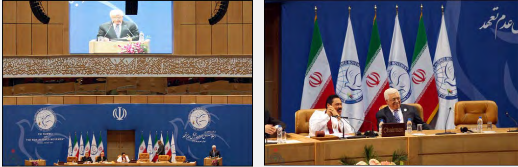
أبو مازن في مؤتمر قمة دول عدم الانحياز (وفا، 30 آب/أغسطس 2012)

■ وأعرب المؤتمر في نهاية مؤتمر القمة عن دعمهم بالقضية الفلسطينية بما في ذلك الحقوق الشرعية للشعب الفلسطيني وإنهاء الاحتلال الإسرائيلي وإقامة الدولة المستقلة وعاصمتها القدس وحق العودة للاجئين الفلسطينيين وتمّ كذلك التعبير عن أنّ القمة تدعم خطوات السلطة الفلسطينية لتعديل مكانتها في الأمم المتحدة وحتى أنها طالبت ممثلي الدول في الأمم المتحدة بتقديم المساعدة للفلسطينيين للقيام بذلك. بالإضافة إلى ذلك طالب المؤتمر بإطلاق سراح السجناء الفلسطينيين المسجونين في إسرائيل على الفور (قدس نت، 2 أيلول/سبتمبر 2012).