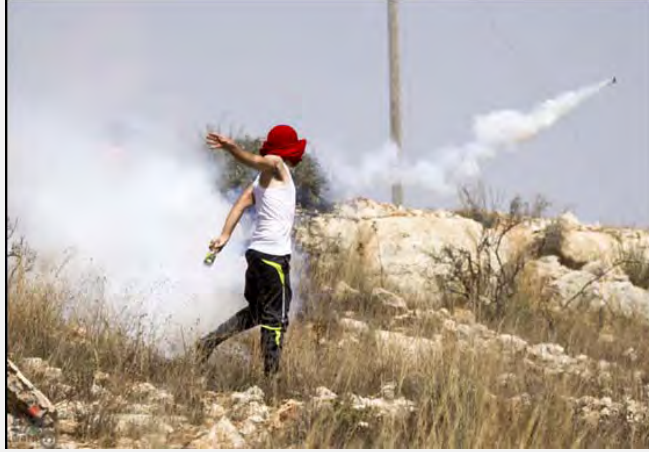
متظاهر فلسطيني يلقي زجاجة حارقة خلال مظاهرة في النبي صالح (صفا، 31 آب/أغسطس 2012)

■ كما هو الحال في كل اسبوع، تمّ تنظيم مظاهرات أيضاً في مواقع الاحتكاك التقليدية في أنحاء الضفة الغربية وبالتحديد في قرى النبي صالح وبلعين ونعلين . وقد ألقى المتظاهرون الحجارة باتجاه قوات الجيش الإسرائيلي، التي ردت في بعض الحالات باستخدام وسائل لتفريق المظاهرات. كما وقعت عدّة حوادث تمّ خلالها القاء الحجارة والزجاجات الحارقة باتجاه سيارات إسرائيلية ولسيارات تابعة لقوات الأمن.