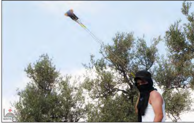
مظاهرات يوم الجمعة في نعلين (وفا، 21 أيلول/سبتمبر 2012)