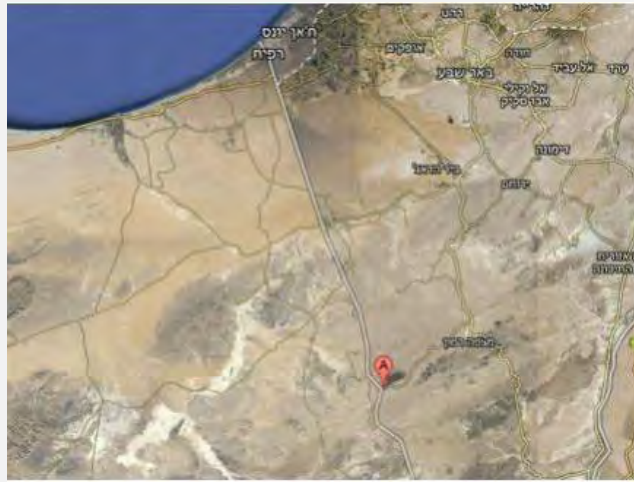
منطقة الحادث على الحدود الإسرائيلية المصرية (الناطق بلسان جيش الدفاع، 21 أيلول/سبتمبر 2012)

■ أعلنت منظمة سلفية جهادية تنشط في شبه جزيرة سيناء تحت اسم أنصار بيت المقدس مسؤوليتها عن الحادث. وجاء في البيان الذي تم نشره على المواقع الإسلامية أن الحادث كان ردًا على الفيلم الأمريكي "المسيء للنبي محمد" والذي اشترك بحسب ادعائها يهود في إنتاجه. وقيل في الإعلان أيضاً أنه تم بالأساس تخطيط الاعتداء الإرهابي انتقاماً على مقتل نشيط في التنظيم في شهر آب/أغسطس الأخير ولكن نشر الفيلم الأمريكي ("براءة المسلمين") هو الذي أدى في نهاية المطاف إلى اتخاذ قرار بالانتقام على المساس بكرامة النبي محمد أولاً وإبقاء الانتقام على مقتل النشيط إلى مرحلة لاحقة. وبحسب الإعلان عن الحادث الإرهابي، والذي كانت تنوي المنظمة اختطاف جندي خلاله، قتل ثمانية جنود إسرائيليون ولكن إسرائيل تنسّر على عدد القتلى (masrawy.com, 23 أيلول/سبتمبر 2012).