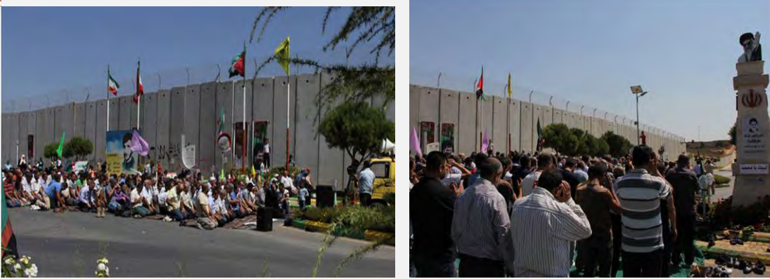
سكان كفر قزلا يؤدون صلاة الجمعة أمام بوابة فاطمة (الانتقاد لبنان، 21 أيلول/سبتمبر 2012)