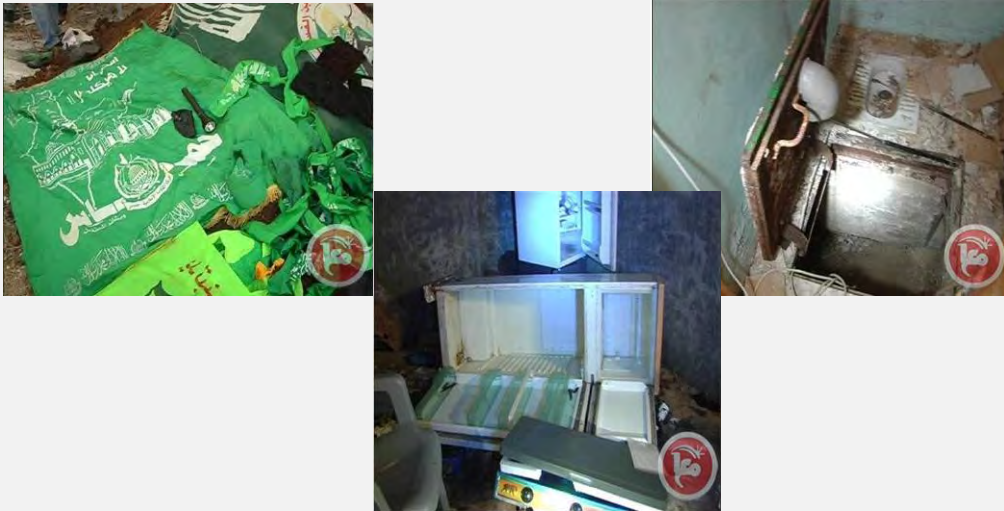
سجن حماس الذي أكتشف في قرية عوريف (معا، 23 أيلول/سبتمبر 2012)