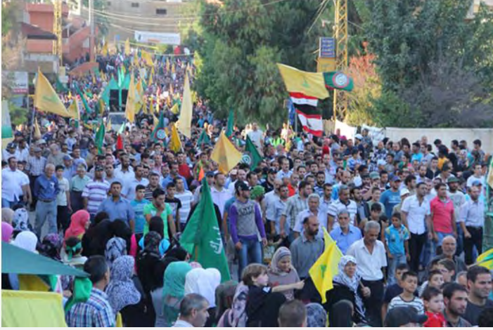
المسيرة الاحتجاجية التي نظمها حزب الله وأمل في بنت جبيل (موقع بنت جبيل لبنان، 22 أيلول/سبتمبر 2012)