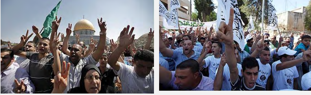
من اليمين: مسيرة احتجاجية في رام الله من اليسار: مسيرة احتجاجية في المسجد الأقصى بعد صلاة يوم الجمعة (منتدى حماس، 21 أيلول/سبتمبر 2012)

■ تمّ في الضفة الغربية والقدس تنظيم عدّة مهرجانات احتجاجية بعد صلاة يوم الجمعة.