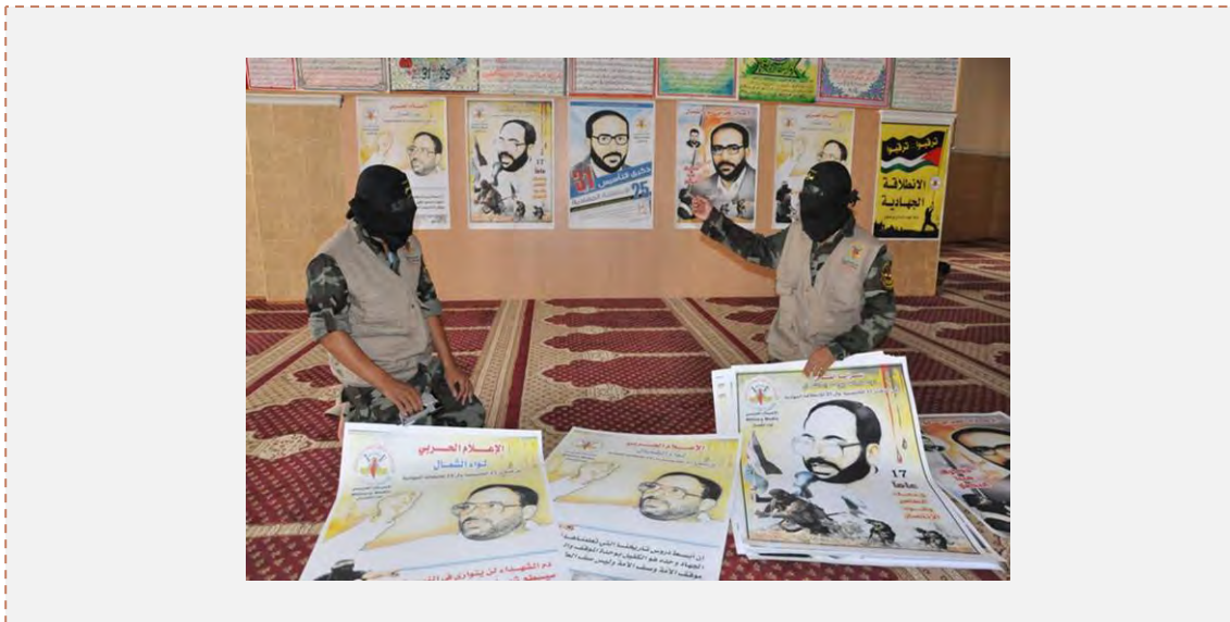
نشاط المنظمة يعلقون لافتات في مساجد شمال القطاع قبيل الحدث المركزي في 4 تشرين الأول/أكتوبر في غزّة