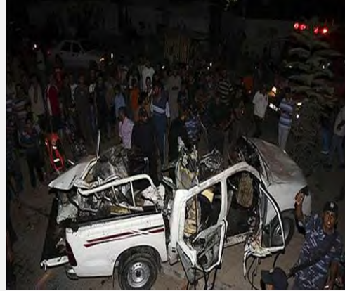
من اليمين: السيارة التي كان الإرهابيون يستقلونها بعد إصابتها (فلسطين الآن، 19 أيلول/سبتمبر 2012) من اليسار: إسماعيل هنية خلال زيارة تعزية في رفح (منتدى حماس، 22 أيلول/سبتمبر 2012)