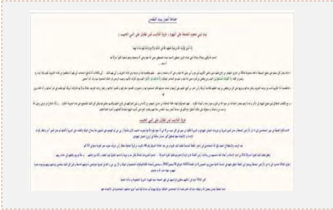
صيغة بيان الإعلان عن المسؤولية لمنظمة أنصار بيت المقدس (www.alwafd.org)