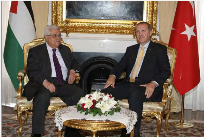
أبو مازن خلال لقائه رئيس الحكومة التركية (وفاء، 21 أيلول/سبتمبر 2012)

■ وكتب أبو مازن على صفحة الفيسبوك التابعة له أنّه مصمّم على تنفيذ الخطوة الفلسطينية في الأمم المتحدة بالرغم من كل الضغوطات التي يتمّ تفعيلها عليه. وبحسب أقواله فإنّه سوف يكشف خلال خطابه أمام الجمعية العامة للأمم المتحدة للعالم كلّ "معاناة الشعب الفلسطيني والانتهاكات الاسرائيلية ضدّه" (معاً، 20 أيلول/سبتمبر 2012).