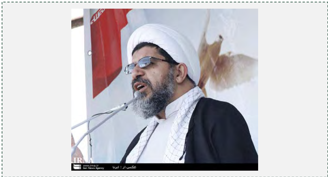
נציג המנהיג בכוח קדס, עלי שיראזי

שיראזי נשאל לגבי מעורבות איראן בסוריה והשיב, כי איראן אינה צריכה להתערב בשלב זה בסוריה כפי שעשתה במלחמת לבנון השנייה או במלחמה בעזה, כיוון שעוצמתה הצבאית של סוריה מספקת. אין צורך בנוכחות צבאית איראנית נרחבת בסוריה ודי ביעוץ איראני למשטר הסורי. צבא סוריה והכוחות העממיים במדינה מסוגלים, לדבריו, להתמודד בעצמם עם אויביהם. איראן מסייעת לסוריה מניסיונה כשם שהיא מוכנה לעשות מול ממשלות ערביות נוספות שהוקמו בעקבות "ההתערורות האסלאמית".