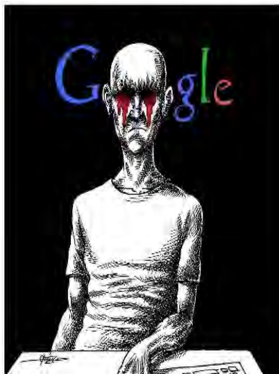
קריקטורה של מאנא ניסתאני (Mana Neyestani), מתוך דף הפייסבוק: Internet Freedom Project | اینترنٹ آزاد

האתר הרפורמיסטי כלמה (Kaleme) מתח, אף הוא, ביקורת על התנהלות השלטונות בנוגע לחסימת הגישה ל-Gmail וטען כי קיים קשר בין חסימה זו לבין תחילת השלב הראשון בהשמשת רשת האינטרנט הלאומית הפנימית. האתר ציין, כי השיבושים בגישה לשירותי האינטרנט מגבירים את הדאגה בקרב הגולשים האיראנים מפני האפשרות שמימוש תוכנית האינטרנט הלאומית יוביל למגבלות ולשיבושים נוספים בגלישה באינטרנט אף על-פי שבכירים איראנים הצהירו בעבר, כי מימוש התוכנית לא יוביל לפגיעה כלשהי בגישה לאינטרנט העולמי ולשירותי הדוא"ל החיצוניים (כלמה, 27 ספטמבר 2012).