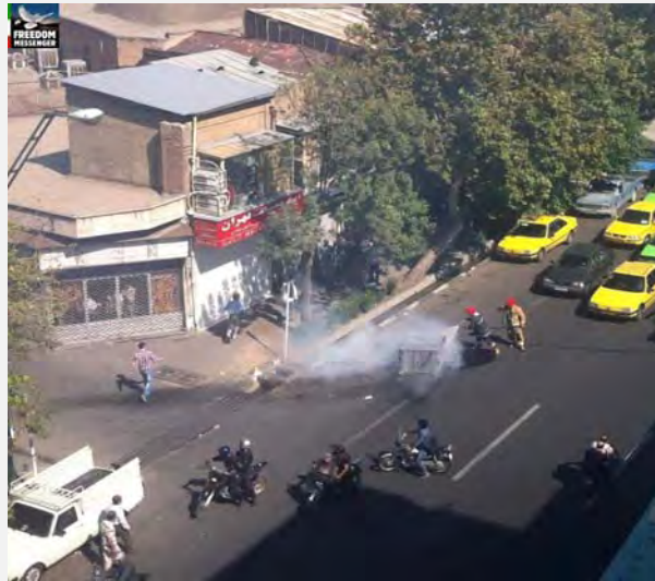
3 אוקטובר 2012

הביטוי החריף ביותר עד כה למחאה ציבורית סביב המשבר הכלכלי ניכר בעימותים האלימים, שפרצו ביום רביעי (3 אוקטובר) בין מפגינים לכוחות ביטחון הפנים באזור השוק של טהראן. במקביל לסגירת החנויות בשוק על-ידי הסוחרים פרצו עימותים אלימים בין כוחות הביטחון לבין מפגינים, שמחו על המצב הכלכלי, קריסת הריאל וחוסר יכולתה של הממשלה לרסן את עליות המחירים. המפגינים קראו סיסמאות בגנות הממשלה והנשיא ואף בגנות המשטר. במהלך האירועים הוצתו כמה עגלות אשפה והותקפו מספר בנקים, תחנות דלק ותחנות אוטובוס. האתר קול המהפכה (נדא-י אנקלאב, Neda-ye Enghelab) דיווח על מעצרם של 150 בני-אדם. במקביל דיווחו אתרים המזוהים עם האופוזיציה הרפורמיסטית על מהומות נקודתיות גם באזור השוק בעיר משהד.