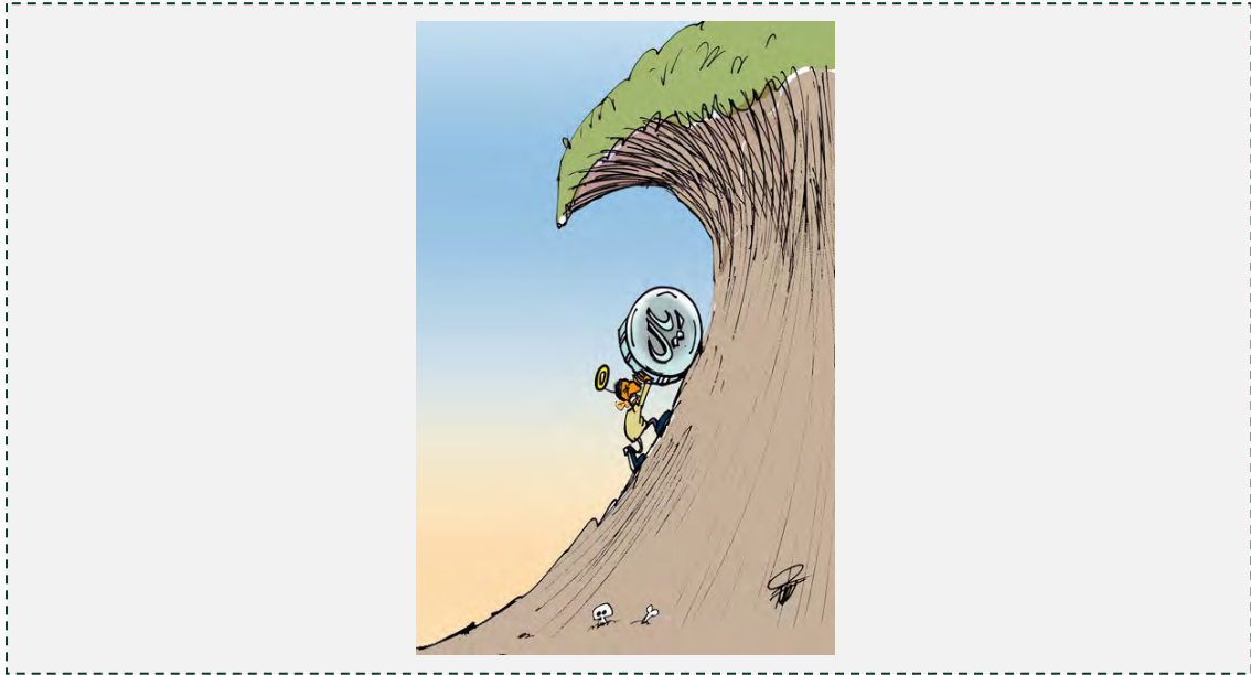
מתוך: רוז אונליין, 3 אוקטובר 2012

גם האתר תאבנאק תקף את הנשיא וטען, כי כשם שהוא התייצב מול התקשורת ודיבר באומץ על נושאים שונים, כגון: הסנקציות והשפעותיהן, היה עדיף אילו הוא היה גם נמנע מלהתחמק מאחריות בנוגע לסוגיות כלכליות שונות, ובהן תרומתו למשבר באמצעות מימוש בלתי נכון של תוכנית הרפורמה בסובסידיות, הזרמת כספים לציבור במקום תמיכה בייצור והגברת הלחץ על המגזר היצרני ועל התעשיינים (תאבנאק, 3 אוקטובר 2012).