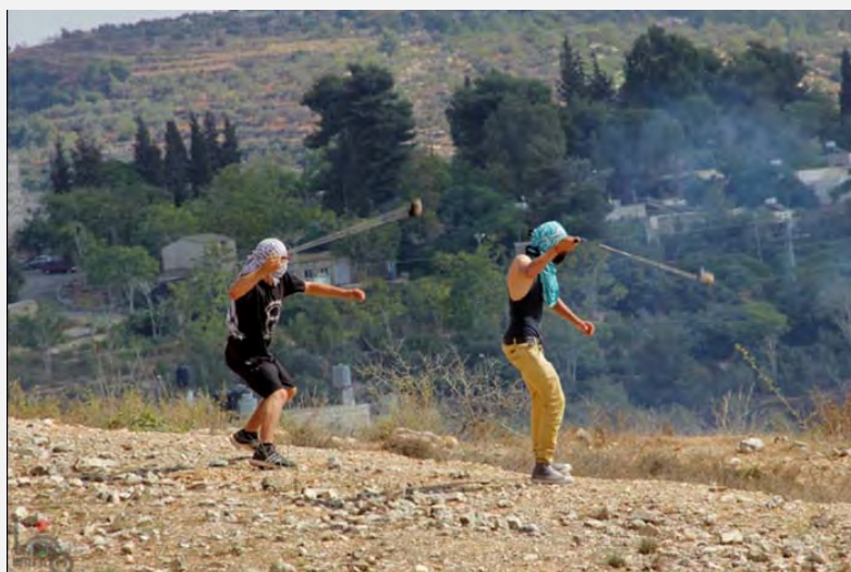
Manifestaciones del viernes en Nabu Saleh (Wafa, 12 de octubre de 2012)