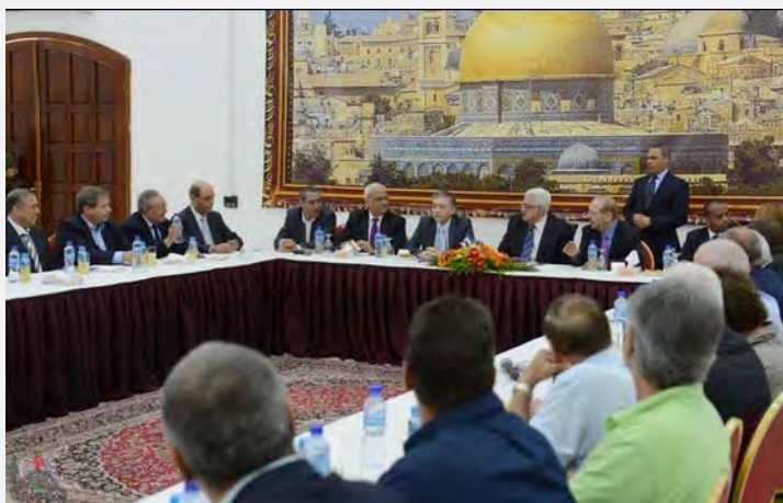
Abu Mazen se encontró con miembros del Parlamento israelí en Ramallah (Wafa, 14 de octubre de 2012)