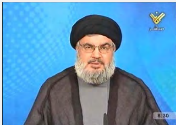
Hassán Nasrallah en un discurso en el que asumió la responsabilidad por el lanzamiento del ANT (avión no tripulado) (canal al Manara, 11 de octubre de 2012)

• Hezbollah continuará activando vuelos de reconocimiento de ANT (aviones no tripulados) por encima de Israel: Hezbollah tiene “ el derecho natural de activar otros vuelos de reconocimiento dentro de la Palestina ocupada siempre y cuando la organización así lo desee ”. Esto, considerando las violaciones aéreas israelíes por encima del cielo de Líbano y sobre el trasfondo de la impotencia del gobierno del Líbano. Por ello, apuntó Nasrallah, “ este vuelo no ha sido el primero ni será el último con la ayuda de Alá alabado sea”