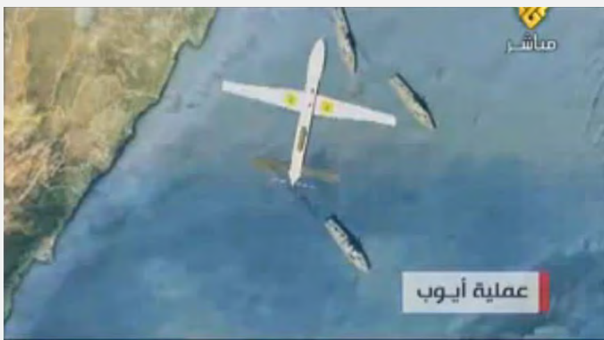
Película de Video publicada por Hezbollah que simula el lanzamiento del ANT (Avión no tripulado), "Operación Hussein Ayoub", hacia territorio de Israel.