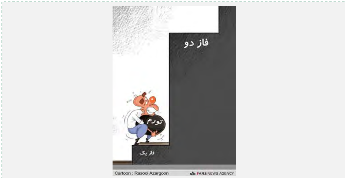
המעבר משלב 1 לשלב 2 ברפורמה

בתוך כך גוברת הביקורת מצד מבקרי הממשלה על כוונתה להמשיך ביישום הרפורמה על אף הבעיות החמורות שהתעוררו במהלך יישום השלב הראשון בתוכנית. מבקרי המהלך הזהירו מפני עליה חדה ביוקר המחיה ומפגיעה נוספת במגזרי התעשייה והחקלאות אם אכן תמשיך הממשלה במימוש התוכנית. בחודשים האחרונים טענו מבקרי הממשלה במספר הזדמנויות, כי אופן יישום השלב הראשון בתוכנית היה שגוי. הממשלה הזדרזה, לטענתם, לממש את הרפורמה במשך שנתיים במקום חמש שנים, יצרה גרעון תקציבי חמור בשל חישוב שגוי של ההוצאות הדרושות לטובת תשלום הקצבאות במסגרת התוכנית, העבירה קצבאות שוות לכלל האזרחים ללא התחשבות בגובה הכנסתם, לא עמדה בהתחייבויותיה להזרים 20% מהכנסות הרפורמה לחיזוק המגזר היצרני ובכך הביאה להחרפת משבר האבטלה ולפשיטות רגל של מפעלים רבים וחרגה מהתקציב שאושר לטובת הרפורמה על מנת לעמוד בתשלום הקצבאות.