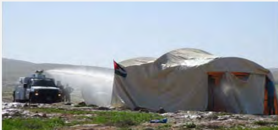
اردوگاه «کنعان» ( http://www.qassam.ps ، یازدهم فوریه 2013)