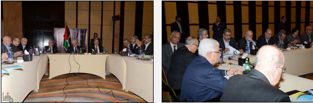
نشست کمیته آشتی فتح و حماس در قاهره به ریاست محمود عباس و خالد مشعل («وفا»، هشتم فوریه 2013)