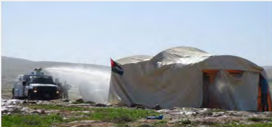
Campamento Canaan (11 de febrero de 2013, http://www.qassam.ps )