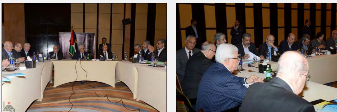
Conferencia de la Comisión de re – organización bajo la dirección de Abu Mazen (Mahmmoud Abbas) y de Khaled Mashal en el Cairo.