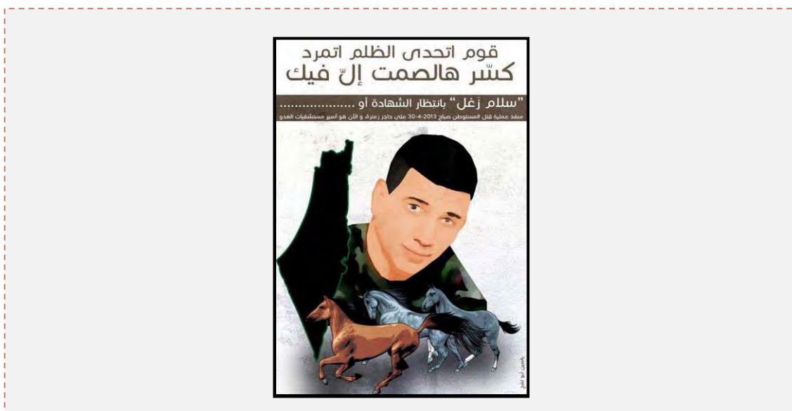
“ Levántate, lucha y rebélate a la opresión. Rompe el silencio de tu boca. Salam Zaghl espera la muerte de santos o...” “Quien realizó el atentado de apuñalamiento del residente en el cruce Tapuah, el 30 de abril de 2012, ahora está preso en uno de los hospitales del enemigo”(página facebook del canal de televisión Alsraa de Tul Karem, 30 de abril de 2013).