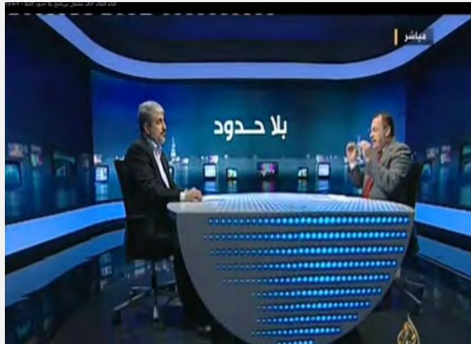
Khaled Mashal en una entrevista para al Jazeera