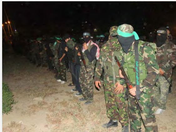
Fotografía de jóvenes que se entrenan en el programa “Alfatuah” ayudando a los activistas del brazo militar de Hamás (foro Hamás, 3 de mayo de 2013).