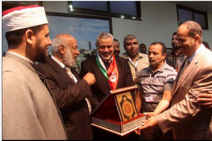
Ismail Haniyeh, a la cabeza del gobierno de Hamás, recibe en su despacho de Gaza a los integrantes del convoy (Filastin al – An, 2 de mayo de 2013)