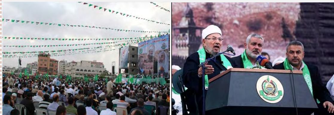
Справа: шейх Юсуф аль Кардави выступает с речью на главном митинге, который был организован в его честь Хамасом на площади аль Катиба в городе Газа (Фалястин аль Ан, 10 мая 2013 г.). Слева: центральный митинг, организованный Хамасом на площади аль Катиба в городе Газа (форум Хамаса, 9 мая 2013 г.)