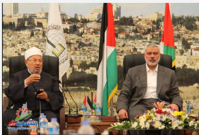
Исмаил Хания, глава администрации Хамаса, принимает шейха Юсуфа аль Кардави в здании администрации Хамаса в Газе (Фалястин аль Ан, 9 мая 2013 г.)