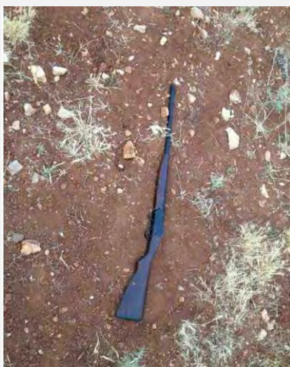
Охотничье ружье, найденное среди вещей палестинца рядом с Кафр Дома (интернет-сайт пресс-службы Армии Оборона Израиля, 9 мая 2013 г.)

■ Силы Армии Оборона Израиля арестовали (9 мая) рядом с Кафр Дома (к северо-востоку от Рамаллы) подозрительного палестинца. Во время обыска в его распоряжении были найдены охотничье ружье, пули и нож. Палестинец был передан силам безопасности для расследования (интернет-сайт пресс-службы Армии Оборона Израиля, 9 мая 2013 г.).