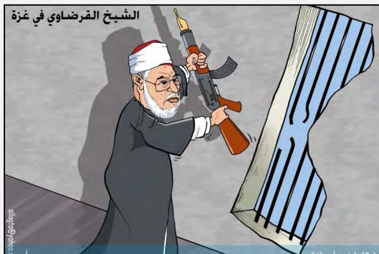
«Шейх аль Кардави в Газе» (Фалястин, 9 мая 2013 г.)