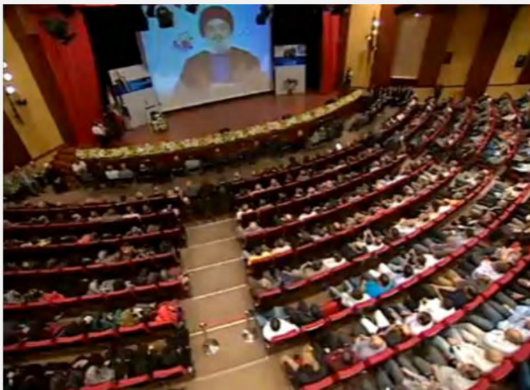
Хасан Насралла, генеральный секретарь Хезболлы, выступает с речью, демонстрируемой на видеоэкране и посвященной 25-й годовщине создания радиостанции аль Нур (Аль Ахд, 9 мая 2013 г.)