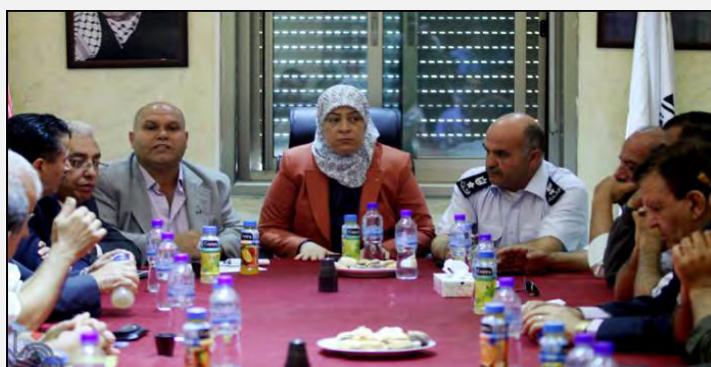
Лайла Ганнам, губернатор округа Рамалла, встретилась с членами верховной национальной комиссии по проведению мероприятий Дня накба в целях подготовки к мероприятиям, посвященных этому дню (БАФА, 9 мая 2013 г.)