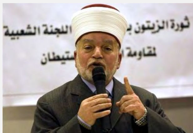
Шейх Мухаммад Хусейн, муфтий Иерусалима и Палестинской автономии, который был арестован Полицией Израиля в связи с подстрекательством (PNN, 8 мая 2013 г.)