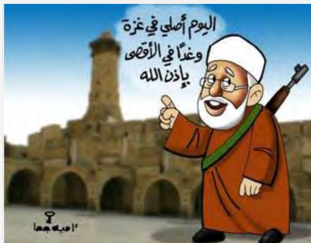
«Сегодня я буду молиться в Газе, а завтра – с помощью Аллаха – в аль Аксе». Карикатура, подготовленная художницей из Газы Умайя Джуха, идентифицируемой с Хамасом, к визиту аль Кардави в сектор Газа (Фалястин аль Ан, 8 мая 2013 г.)