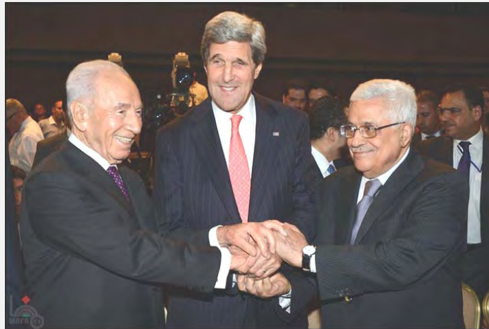
Rencontre entre le Président israélien Shimon Peres, le secrétaire d'Etat américain John Kerry et le Président de l'Autorité Palestinienne Mahmoud Abbas au sommet économique de Jordanie