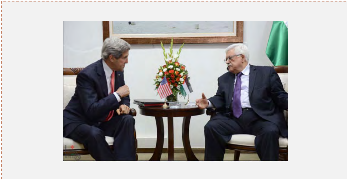
John Kerry, le secrétaire d'Etat américain, reçu par Mahmoud Abbas

les deux côtés devaient prochainement prendre des décisions difficiles afin de reprendre les négociations, puisque la situation actuelle ne peut pas durer et que les dirigeants des deux côtés doivent œuvrer à l'atteinte de la paix (Al-Hayat al-Jadeeda, 25 mai 2013).