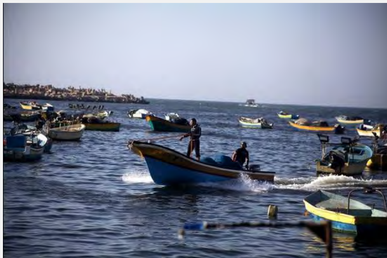
Pêcheurs près des côtes de Gaza (Filastin al-A'an, 22 mai 2013)