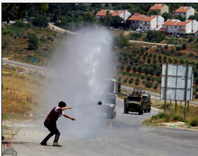
Palestinien lançant des pierres sur des soldats et des policiers israéliens à une manifestation hebdomadaire contre la barrière à Beni Salah (Wafa, 24 mai 2013)

■ Cette semaine encore, les affrontements entre Palestiniens et forces de sécurité israéliennes se sont poursuivis aux points de friction habituels dans le cadre des activités de "résistance populaire". Selon les médias palestiniens, plusieurs émeutiers palestiniens auraient été blessés dans des manifestations (Al-Hayat al-Jadeeda, Ma'an, 24 mai 2013).