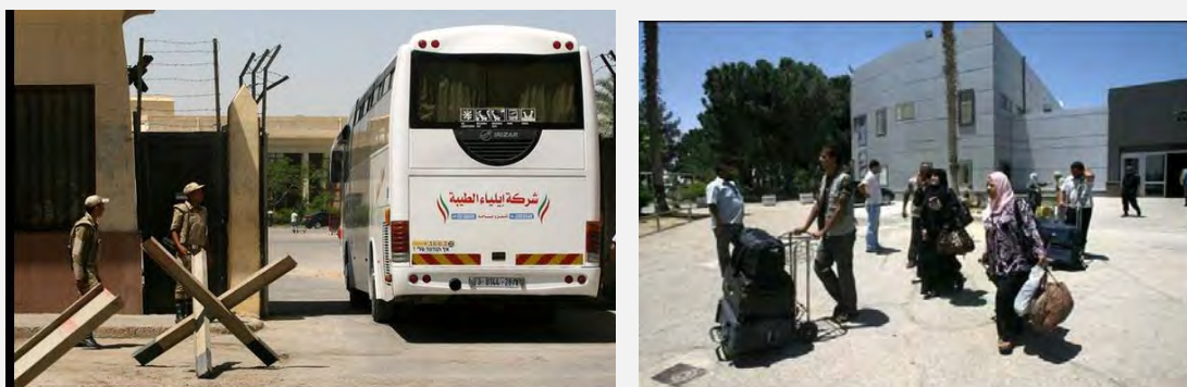
Réouverture du terminal de Rafah au passage des voyageurs suite à la libération des soldats égyptiens kidnappés (Filastin al-A'an, 22 mai 2013)

personnes pouvant entrer et sortir (Al-Ra'i, 22 mai 2013). Suite à la reprise des activités, la plupart des Palestiniens qui avaient été bloqués du côté égyptien du terminal sont rentrés chez eux. Dans son sermon du vendredi, Ismail Haniya a appelé l'Egypte à mettre au point une politique nouvelle au sujet du terminal de Rafah afin qu'il ne soit pas influencé par des événements internes égyptiens dans le futur (Al-Ayam, 25 mai 2013).