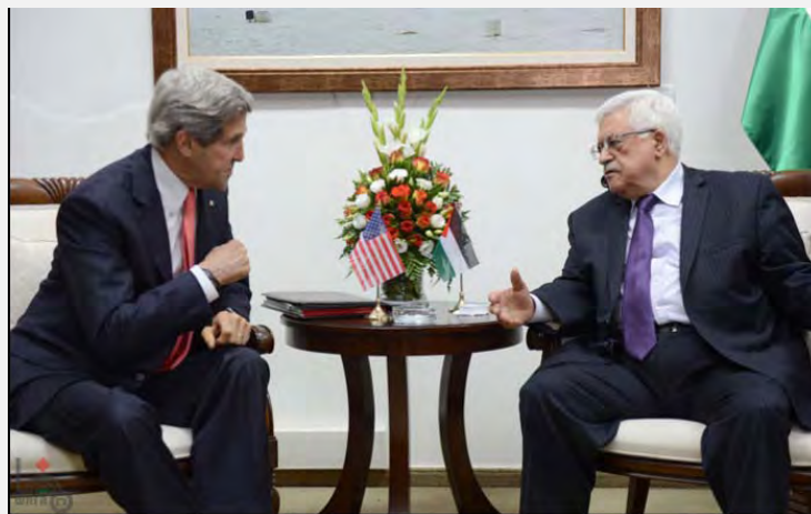
אבו מאזן נפגש בראמאללה עם ג'ון קרי, מזכיר המדינה האמריקאי (ופא, 23 במאי 2013)

■ ביקורו של ג'ון קרי, מזכיר המדינה האמריקאי, ברשות הפלסטינית ובישראל וסבב הפגישות שערך הסתיים ללא פריצת דרך וללא הכרזה על חידוש המשא ומתן. עם סיום ביקורו אמר קרי, כי על שני הצדדים לקבל בתקופה הקרובה החלטות קשות לצורך חידוש המשא ומתן שכן המצב הנוכחי אינו יכול להימשך ועל מנהיגי שני הצדדים לפעול למען הגעה לשלום (אלחיאת אלג'דידה, 25 במאי 2013).