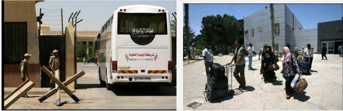
מסוף רפיח נפתח שוב לתנועת נוסעים פלסטיניים בעקבות שחרור החיילים המצריים החטופים (פלסטין אל'אן, 22 במאי 2013)