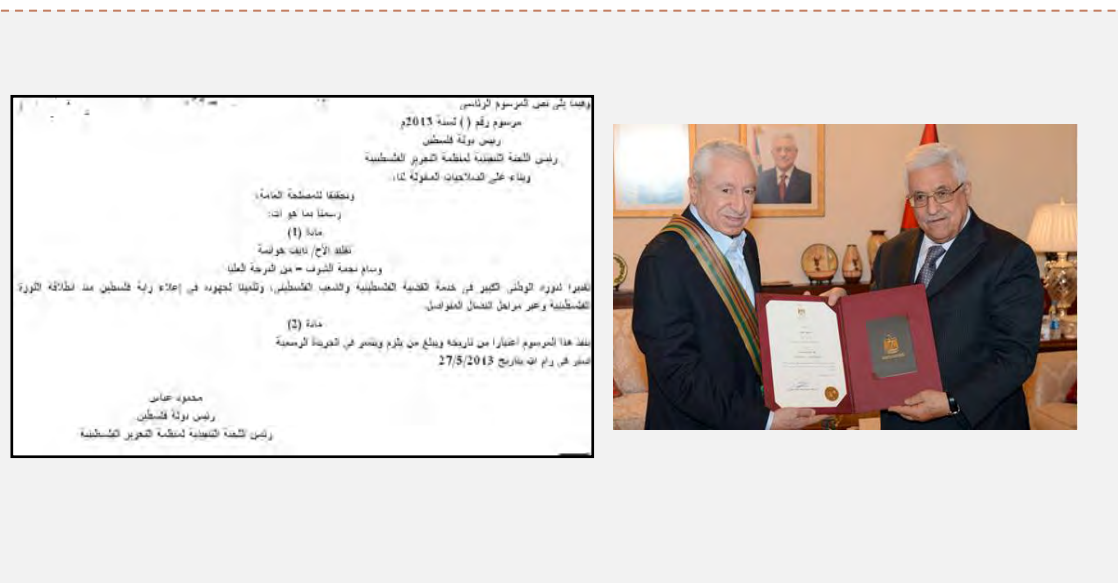
מימין : אבו מאזן מעניק את עיטור הכבוד לנאא'ף חואתמה. משמאל : הצו הנשיאותי הרשמי המורה על הענקת עיטור הכבוד (ופא, 27 במאי 2013)

■ בעת שהותו בירדן העניק אבו מאזן "עיטור כבוד מדרגה עליונה" לנאא'ף חואתמה, מזכ"ל החזית הדמוקרטית לשחרור פלסטין. העיטור הוענק לו על-פי צו נשיאותי רשמי, שהוציא אבו מאזן, כהוקרה ל"תפקידו הלאומי לטובת הסוגיה הפלסטינית והעם הפלסטיני תוך הערכה למאמציו להגביה את דגל פלסטין במהלך שלבי המאבק הפלסטיני" (ופא, 27 במאי 2013).