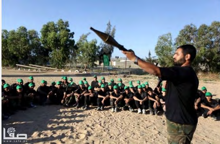
הדרכה בירי RPG של ילדי מחנה קיץ של חמאס (פלסטין אל'אן, 16 ביוני 2013)