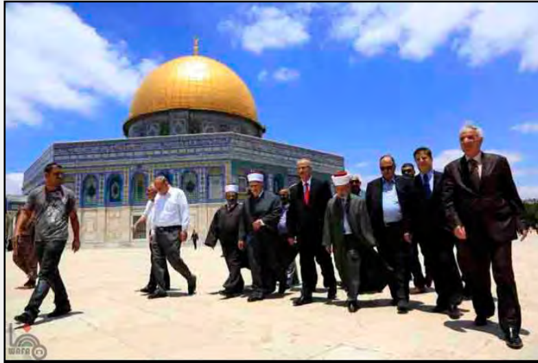
ראמי חמדאללה (במרכז התמונה), ראש הממשלה החדש ברשות הפלסטינית, מבקר בהר הבית (16 ביוני 2013)