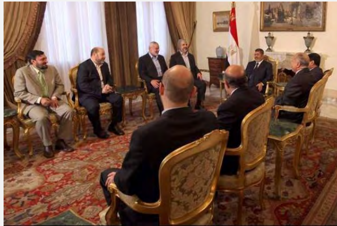
Una delegación de funcionarios de alto grado de Hamás, en una reunión con Mohamed Mursi, Presidente de Egipto (Filastin al – An, 18 de junio de 2013)