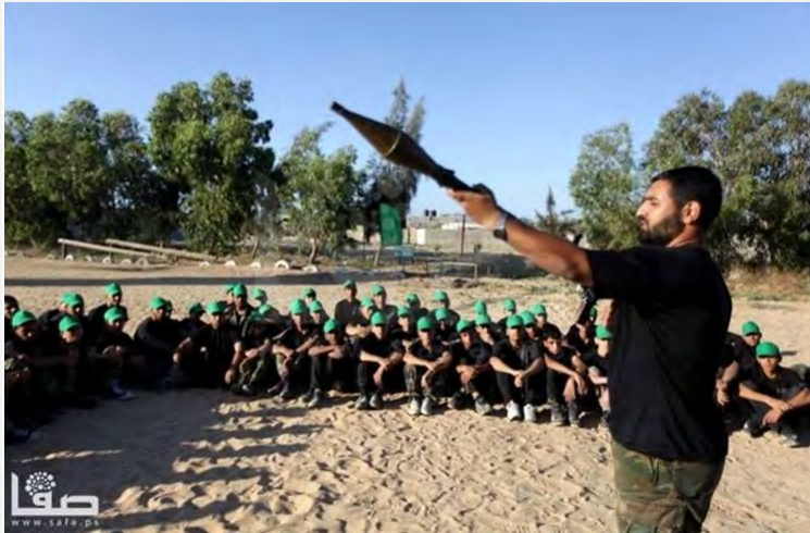
Instrucciones a los chicos del campamento de verano de Hamás, para disparar con RPG (Filastin al – An, 16 de junio de 2013)