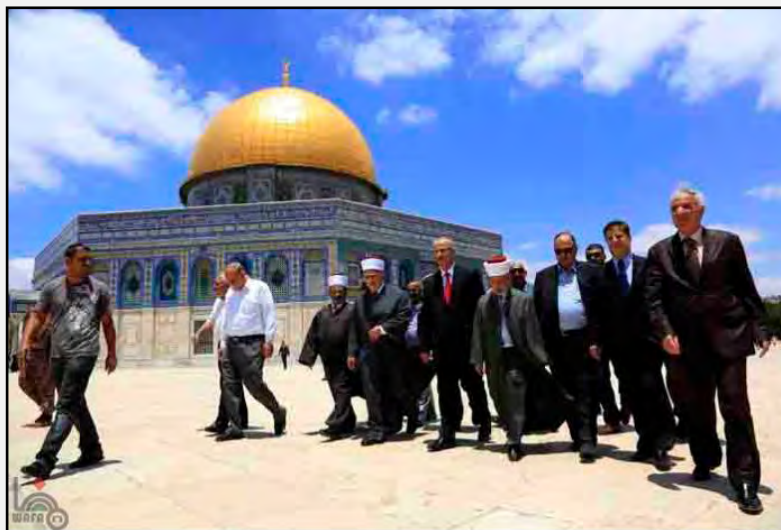
Rami Hamdallah, (en el centro de la fotografía), nuevo Primer Ministro de la Autoridad Palestina, en una visita al Monte del Templo (WAFA, 16 de junio de 2013)