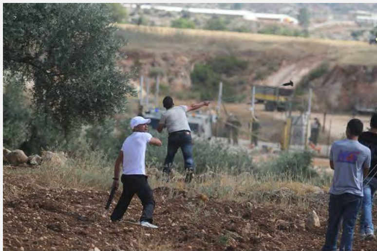
Jóvenes palestinos se enfrentan con las fuerzas de Tzáhal durante el “desfile del retorno a los pueblos de Latrún” al oeste de Ramallah (Pal Today, 15 de junio de 2013)

■ Continuaron los enfrentamientos y fricciones violentos entre palestinos y las fuerzas de seguridad israelíes en los focos de fricción tradicionales, en el marco de lo que llaman “la resistencia popular”. El 15 de junio de 2013, algunos habitantes de los pueblos palestinos al oeste de Ramallah, realizaron un desfile al que llamaron “desfile de retorno a los pueblos del wadi Latrún” (“wadi” = lecho de un río seco). Los manifestantes llegaron al lado de la valla de seguridad en el pueblo de Beit Lakia, donde comenzaron a conducirse en forma violenta arrojando piedras contra las fuerzas de Tzáhal. Según lo dicho por Ahmed Alrab, quien había organizado el desfile, este evento tenía como objetivo destacar el 45 aniversario de la destrucción de poblados en el área de Latrún. Alrab acentuó que con este desfile se quería expresar la negación a renunciar al derecho al retorno y asimismo la no aceptación de la idea del intercambio de territorios, en el marco de los futuros arreglos políticos entre Israel y la Autoridad Palestina (foro Visión, 15 de junio de 2013).