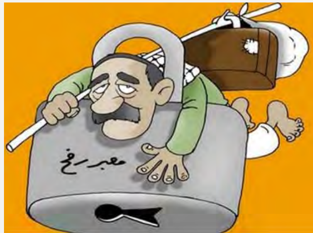
El cierre del cruce Rafiah por parte de los egipcios ahoga a los habitantes de la Franja de Gaza (Filastin al-An, 11 de julio de 2013)