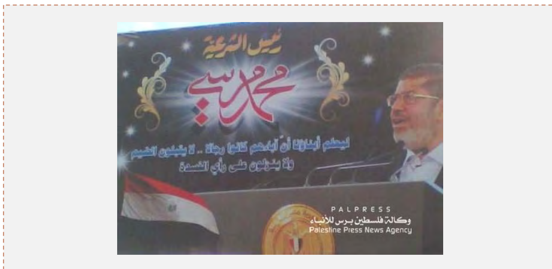
Pancartas en las calles de Gaza que expresan su apoyo a Muhamed Mursi (13 de julio de 2013)