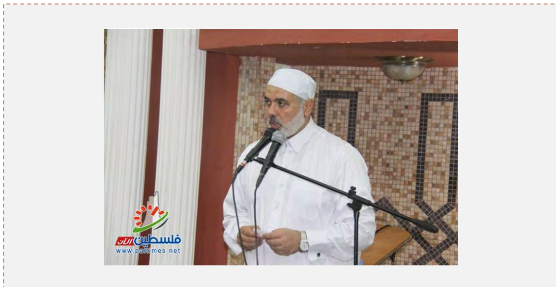
Ismail Haniyeh rechaza las acusaciones contra Hamás en su sermón del viernes (Filastin al – An , 14 de julio de 2013)