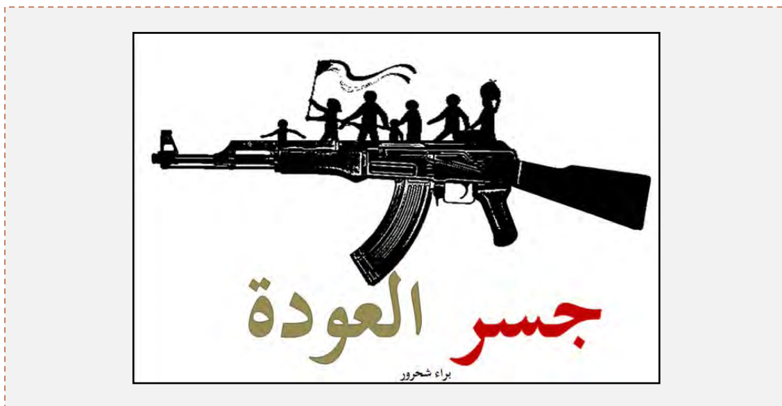
“El puente del retorno” (página Facebook de Fatah, 4 de julio de 2013)