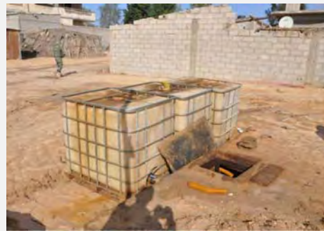
El ejército egipcio actúa contra los túneles de contrabando de combustible en la parte egipcia de Rafiah (Shahab, 14 de julio de 2013)