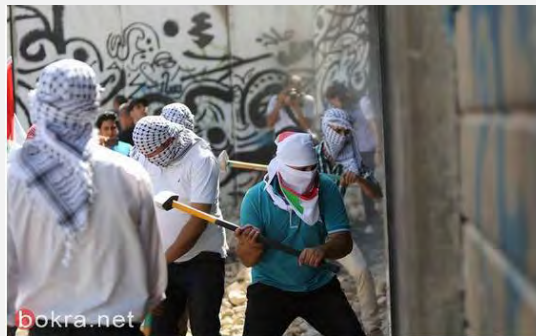
Activistas de la “resistencia popular” abren boquetes en la valla de seguridad en Abu Dis (Bukhara Net, 9 de julio de 2013)