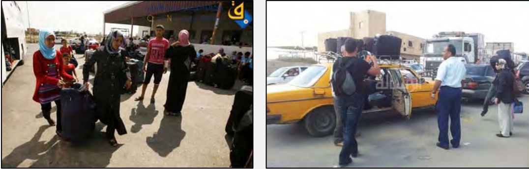
La estación terminal de Rafiah fue abierta en forma parcial al tráfico entre las fechas 11 – 12 de julio de 2013 (foro Hamás, Quds-Net, 11 de julio de 2013)