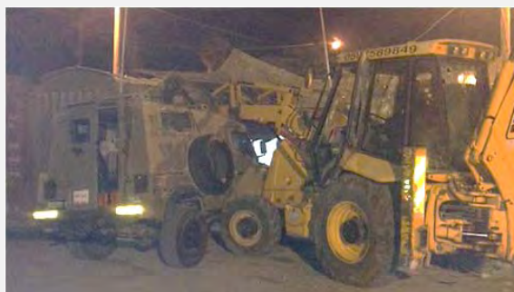
פיגועי דריסה : ב-17 באוקטובר 2013 ניסה פלסטיני לחדור לבסיס צה"ל סמוך לא-ראם (דרומית מזרחית לראמאללה) כשהוא נוהג בטרקטור. בתמונה: כף הטרקטור מנסה לפגוע בג'יפ צבאי בבסיס צה"ל סמוך לא-ראם ( דובר צה"ל, 17 באוקטובר 2013 )