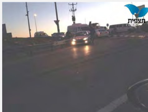
פיגועי דקירה : שוטר ישראלי נדקר בכניסה להתנחלות אדם (צפונית לירושלים). מימין: מקום הדקירה בצומת אדם (סוכנות תצפית , 23 בדצמבר 2013). משמאל: כוחות הביטחון במרדף אחר הדוקר (דוברות מחוז ש"י, 23 בדצמבר 2013)