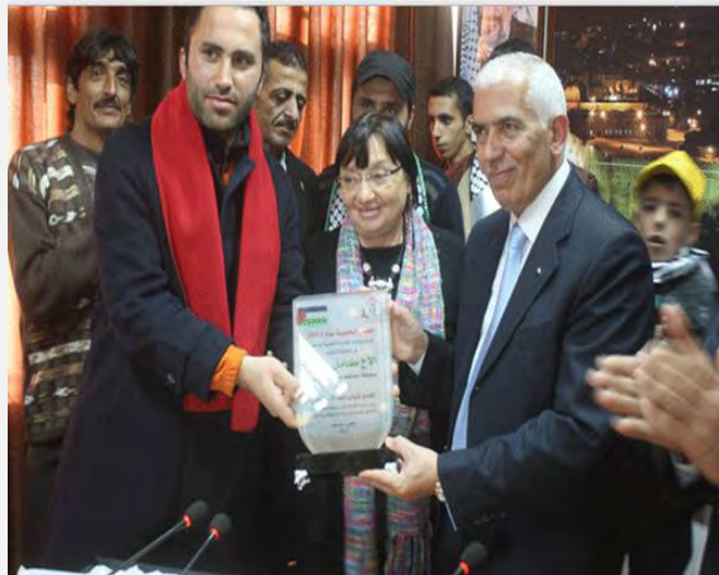
הענקת מגן הוקרה למושל חברון מלואיזה מורגנטיני, לשעבר סגנית ראש הפרלמנט האירופאי, בגין תמיכתו במה שמכונה "ההתנגדות העממית בדרכי שלום" (אתר משרד מושל חברון, 2 בינואר 2014)

לגיטימציה לאלימות: הענקת מגן הוקרה למושל חברון בגין תמיכתו ב"התנגדות העממית" בהשתתפות משלחת איטלקית, בראשות חברת הפרלמנט האירופאי מטעם איטליה. "ההתנגדות העממית" כוללת פעולות אלימות ובכלל זה יידוי אבנים, השלכת בקבוקי תבערה ופיגועי דקירה ודריסה 1