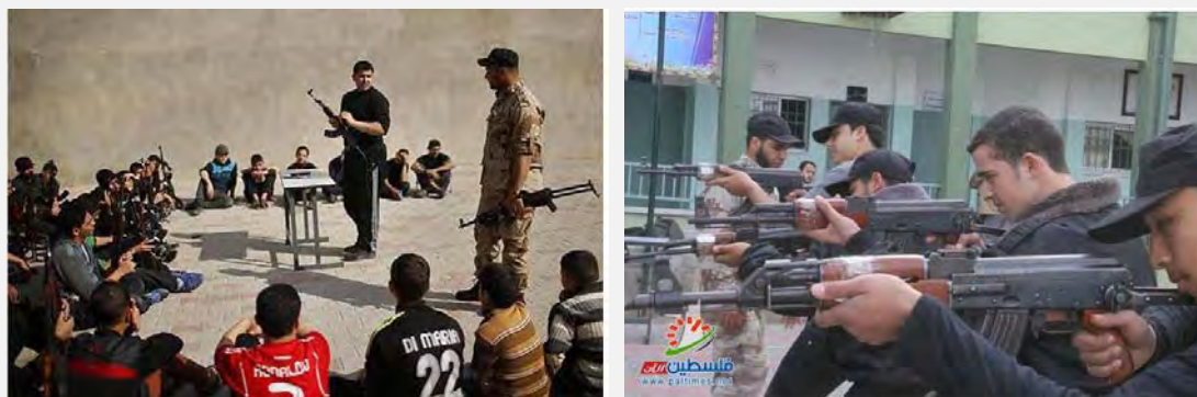
عکس راست: جوانان فلسطینی در حال آموزش نظامی (وبسایت «فلسطین الان» 12 ژانویه 2014). عکس چپ: افسری از اعضای تشکیلات امنیتی حماس در حال دادن آموزش کاربرد اسلحه به نوجوانان فلسطینی (وبسایت «فلسطین اینفو» هفتم ژانویه 2014).

■ وزارت آموزش و پرورش در دولت حماس با مشارکت وزارت کشور در این دولت در روز هفتم ژانویه 2014 از آغاز دوره جدید اجرای طرح «الفتوا» برای دوره های نظامی برای نوجوانان و جوانان فلسطینی در 46 دبیرستان در غزه خبر داد. این برنامه با عنوان «پیشگامان پیروزی 2» به اجرا گذاشته شده است. برنامه ریزان این طرح می گویند، امسال سیزده هزار دانش آموز فلسطینی، از میان دانش آموزان کلاس دوازدهم دبیرستان های غزه دوره های آموزش نظامی را طی می کنند (این تعداد معادل یک سوم شمار کلی دانش آموزان دبیرستانی در غزه است) در حالی که شمار دانش آموزانی که چنین دوره ای را در سال قبل گذرانده بودند به پنج هزار نفر رسیده بود (شبکه تلویزیونی «الاقصى» در غزه نهم ژانویه 2014). 4