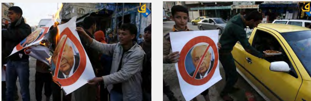
فلسطینی ها از مرگ آریئل شارون ابراز خرسندی می کنند؛ به توزیع شیرینی درخیابانها اقدام کرده و عکس های شارون را به آتش می کشند (وبسایت «قدس نت» یازدهم ژانویه 2014)