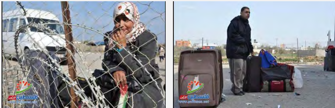
مردم فلسطینی در انتظار خروج از نوار غزه در گذرگاه الرفح هستند (وبسایت «فلسطین الان» نهم ژانویه 2014)

■ در روز هشتم ژانویه 2014 حاکمیت جدید مصر موافقت کرد که گذرگاه الرفح میان مصر و غزه را به طور محدود فعال کند. در دو هفته پیش از آن این گذرگاه به طور کامل بسته بود. اما پس از بازگشایی نیز بر اثر آنچه که «خراب بودن کامپیوترها» برای ثبت رفت و آمد فلسطینی ها میان مصر و غزه اعلام شد، کار گذرگاه دوباره با اخلال روبرو گردید و لذا دوباره بسته شد. دولت حماس از دولت مصر خواست که سیاست کنونی خود را مورد «بازنگری» قرار دهد و برای برقراری تسهیلاتی در زندگی مردم غزه بکوشد (وبسایت «فلسطین اینفو» هفتم ژانویه 2014).