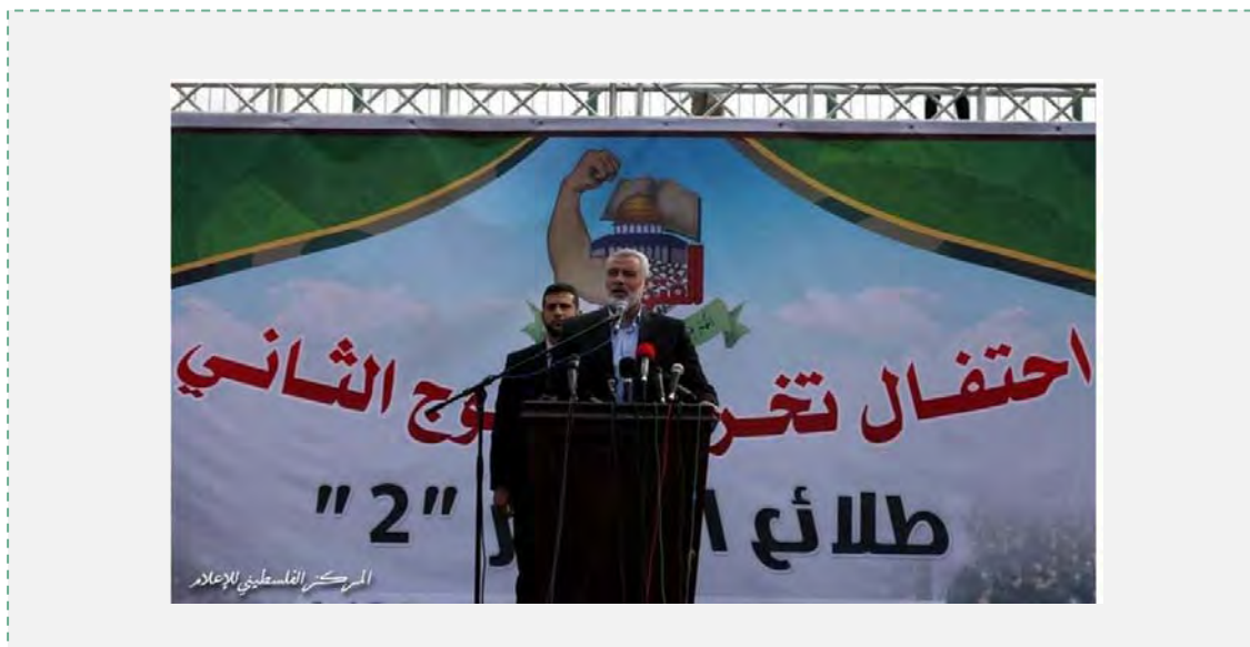
בכירי חמאס בטקס הסיום (פלסטין אינפו, 14 בינואר 2014).

8. יישומה של תוכנית ההכשרה הצבאית הינה חלק מפעילות מקיפה יותר, מעשית ותודעתית, שמקיימת חמאס בקרב הדור הצעיר ברצועת עזה. פעילות זאת, המתחילה בגני הילדים ומסתיימת באוניברסיטאות, נועדה לטפח קאדר איכותי חדש של פעילים צבאיים ופוליטיים, ולהטמיע בקרבם את הערכים האידיאולוגיים של חמאס ("שחרור פלסטין", סירוב להכרה בישראל, תרבות הג'האד וההקרבה למענו, האסלאם הרדיקלי).