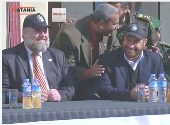
טקס פתיחת מחנות "אלפתוה" ברצועת עזה בהשתתפות אסאמה אלמזיני, שר החינוך בממשל חמאס, ופתחי חמאד, שר הפנים (וטניה, 7 בינואר 2014)

נועדה להכשיר את התלמידים במיומנויות לחימה ולהיכרות עם כלי נשק כדי שיוכלו להתנגד ל"כיבוש". אלמזיני גינה את אלה המותחים ביקורת על מחנות אלה בטענה, כי הם מחנכים ל אלימות ולטרור, בציינו כי "מחנות אלה נועדו לטעת ערכים טובים בחברה" 1 (אלראי, פלסטין אלן, 7 בינואר 2014). פתחי חמאד , שר הפנים בממשל חמאס אמר, כי לתלמידים, שהצטרפו למחנות, יהיה "תפקיד ראשי בשחרור מסגד אלאקצא מטומאת הכיבוש". לדבריו, ראוי להתאמן ולהתכונן "לשלב השחרור הבא של אשדוד, יבנה, יפו, עכו, לוד, רמלה וכל כפר בפלסטין" (אלראי, פלסטין אלן, 7 בינואר 2014).