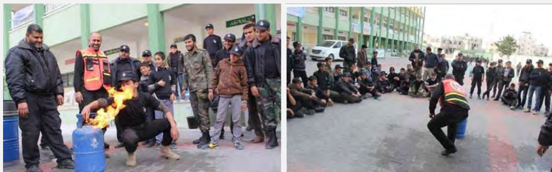
סדנה בכיבוי אש וטיפול במיכלי גז בוערים באחד מבתי הספר ברפיח (אתר משרד הפנים של ממשל חמאס בעזה, 11 בינואר 2014)