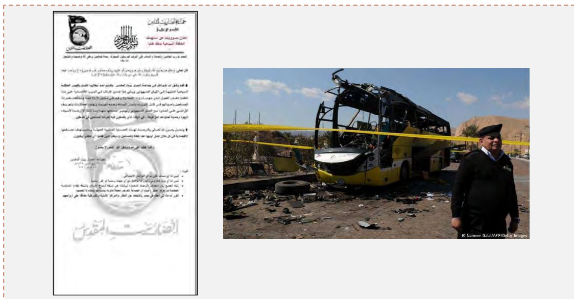
Справа: остатки автобуса, пострадавшего в теракте (DW Media Center, 17 февраля 2014 г.). Слева: сообщение организации Ансар Байт аль Макдис о принятии ею ответственности за совершение теракта (аль Вафт, 18 февраля 2014 г.)

■ Организация Ансар Байт аль Макдис – это салафитская джихадистская организация, идентифицируемая с Всемирным джихадом и играющая центральную роль среди организаций, действующих на полуострове Синай. В прошлом эта организация совершила многочисленные теракты против сил безопасности Египта. Наряду с этим в прошлом эта организация в нескольких случаях брала на себя ответственность за ракетные обстрелы города Эйлата (в том числе за три ракеты, которые были выпущены по Эйлату в январе 2014 г.).