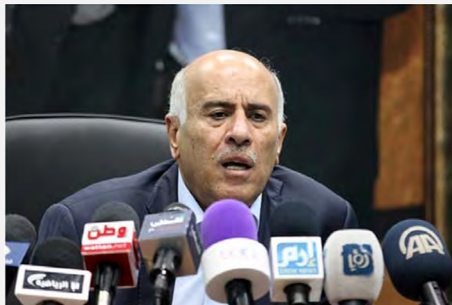
Пресс-конференция, устроенная Джибрилом Раджубом. Он призывал к спортивному бойкоту Израиля (интернет-сайт палестинской футбольной ассоциации, 12 февраля 2014 г.)

(интернет-сайт футбольной ассоциации Палестинской автономии, 12 февраля 2014 г.). Джибриль Раджуб не впервые в рамках своей должности председателя футбольной ассоциации предпринимает шаги по бойкотированию Израиля на спортивных площадках мира.