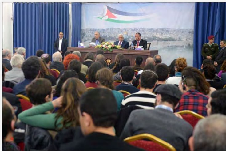
Встреча Махмуда Аббаса с израильскими студентами в Рамалле (ВАФА, 16 февраля 2014 г.)

■ Ниже приведены основные моменты выступления Махмуда Аббаса (аль Хаят аль Джедида, А-Арец, 17 февраля 2014 г.):