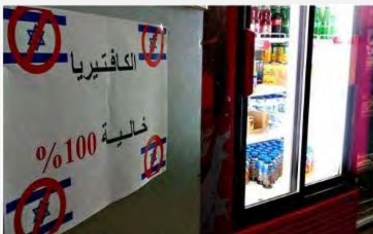
Плакат, вывешенный в кафетерии, указывает на то, что там не продаются израильские товары (страница Facebook исламистской фракции университета аль Наджах в Шхеме, 11 февраля 2014 г.)