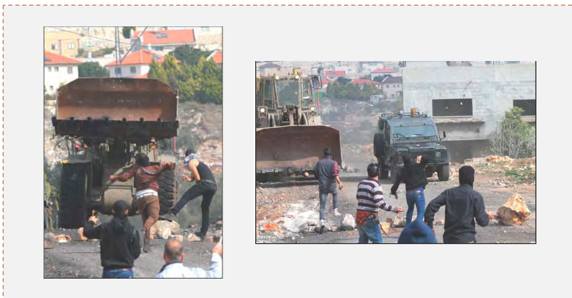
Палестинцы во время еженедельной демонстрации в деревне Кадум бросают камни по военнослужащим сил безопасности Израиля (ВАФА, 14 февраля 2014 г.)