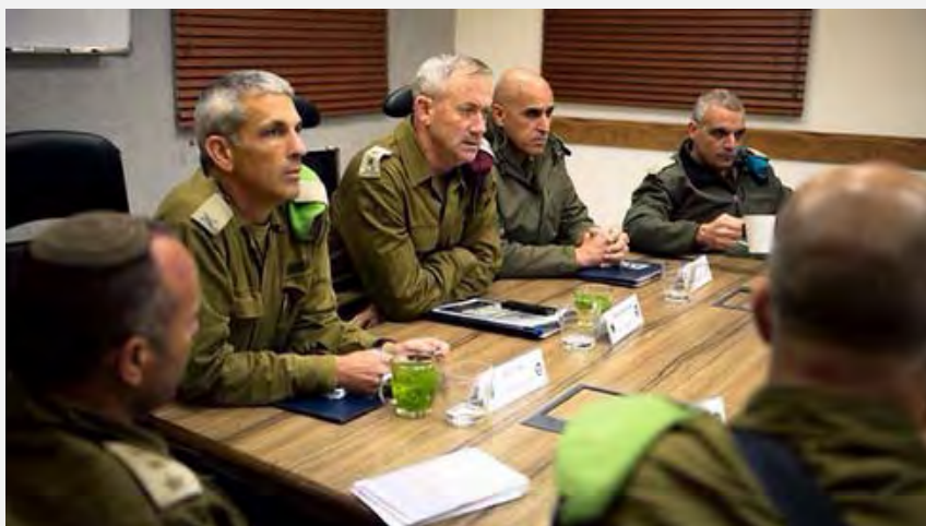
הערכת מצב בצה"ל (דובר צה"ל 12 במרץ 2014)

12. בעקבות הירי המאסיבי הורה שר הביטחון על סגירת המעבר כרם שלום ועל פעילות מצומצמת בלבד של מעבר ארז. לדבריו החזרה למתכונת פעילות מלאה תתקבל על פי הערכת המצב ועל פי שיקולים ביטחוניים. המעבר נפתח מחדש ב-16 במרץ 2014 לצורך הכנסת דלק לרצועת עזה בשל מצוקת הדלק בה היא שרויה (ynet, 15 במרץ 2014).