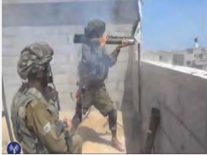
تنشط قوات جيش الدفاع داخل قطاع غزة (الناطق بلسان جيش الدفاع, 28 من تموز 2014)