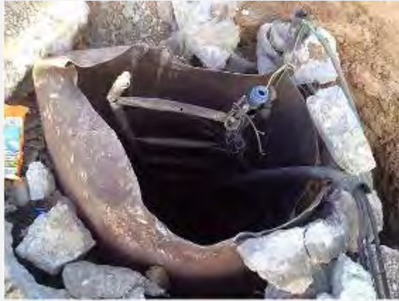
اكتشاف انفاق (الناطق بلسان جيش الدفاع, 28 من تموز 2014)